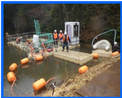
①台船での浚渫(土砂上げ)