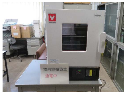
(土壌の恒温乾燥器)