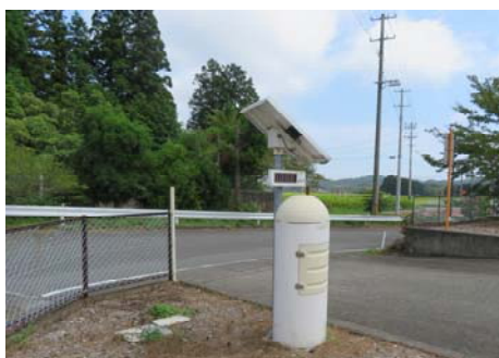
(亀ヶ崎地区集会所)