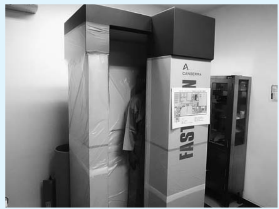
検査体制の充実へ（ホールボディーカウンター）

放射線による健康不安を解消するため、保健センターにホールボディーカウンターを設置し、内部被ばく検査の充実を図ります。さらに、甲状腺検査を定期的を実施します。