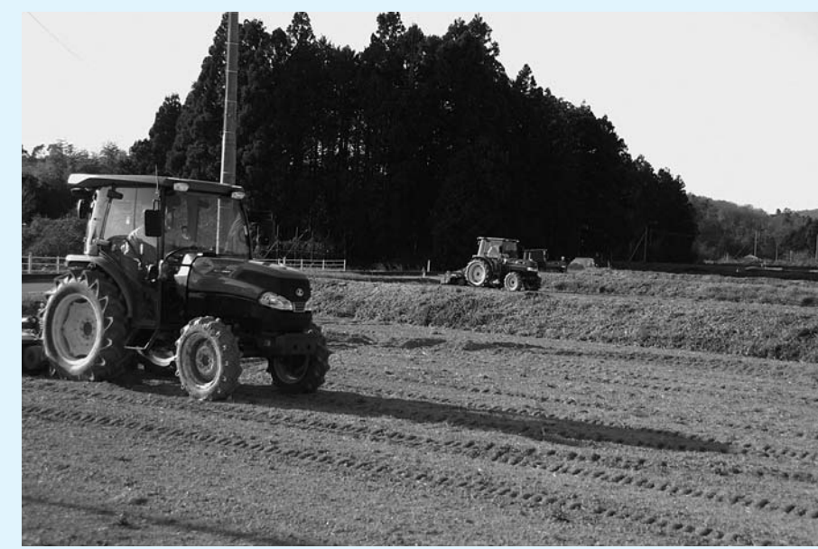
営農再開へ向けた除染

農地集積への支援などを含め地域農業の復興を図るためのマスタープランを作成します。