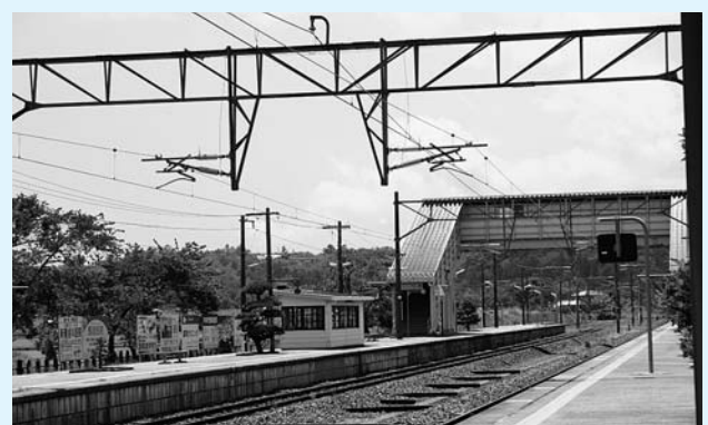
3月ダイヤ改正で2往復増えました

町内に戻っている方の交通手段を確保するため、JR常磐線を利用した方に、運賃の一部を助成します。 (対象区間は広野駅～いわき駅間 通学定期は広野駅～勿来駅までを予定)