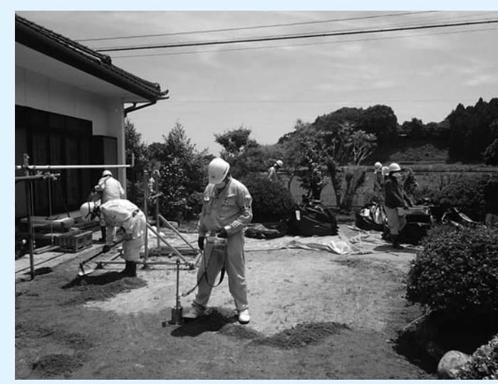
除染作業のようす