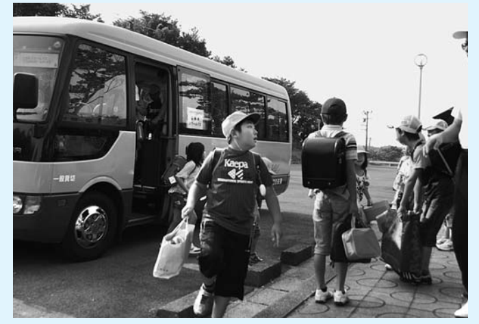
引き続き運行されるスクールバス

町内の本校舎で再開した小中学校に通学する児童生徒を対象に、スクールバスを引き続き運行します。 教育施設での放射能に対する不安解消と教育環境の改善に取り組みます。