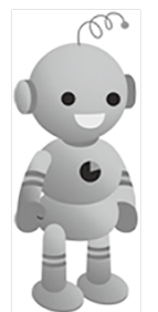
工業統計キャラクター コウちゃん