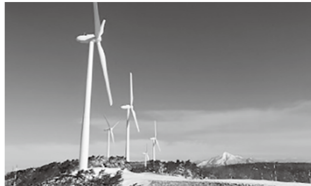
弊社の会津若松ウィンドファーム

そこで、現在、いわき市の屹兔屋山、猫鳴山周辺といわき市と広野町、楡葉町の行政境の尾根部分で風力発電事業の可能性調査を行っています。その可能性調査の一環として、環境影響評価法に基づき、環境影響評価項目の考え方と、周辺環境の調査方法を記載した「方法書」の作成を行いました。そこで、以下のとおり、「方法書」図書の、縦覧および説明会開催について、お知らせいたします。