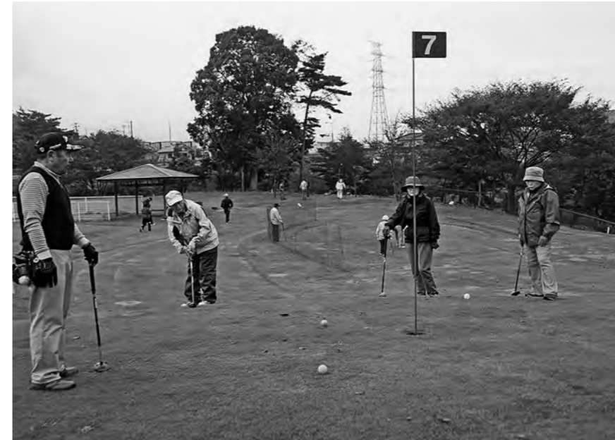
↓パークゴルフを楽しんでいる参加者たち