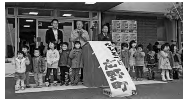
↑復興祭のオープニングセレモニーの様子

復興収穫市では、宮崎産地鶏や豚汁の無料配布が行われ、広野産のお米や野菜を買い求める来場者で賑わいました。