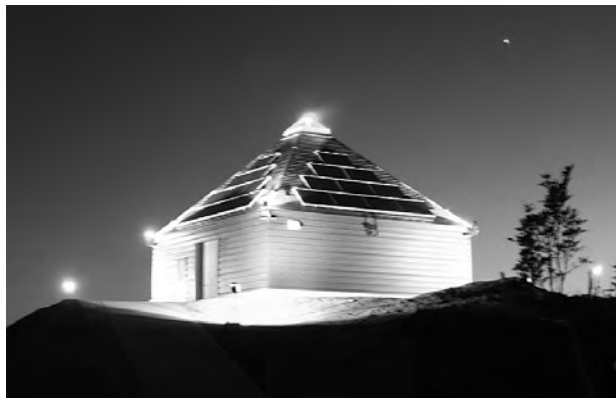
↓ライトアップされているピラミッド型施設