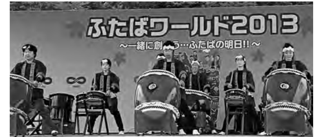
↓広野昇龍太鼓を披露しているみなさん