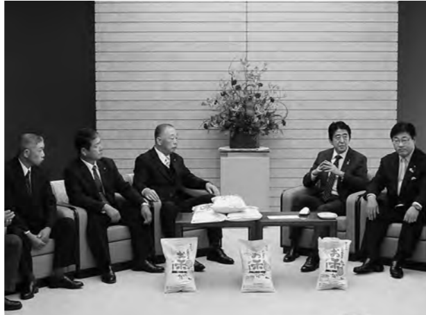
↓広野産の米をPRする山田町長