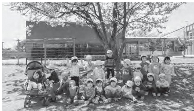
↑園庭の桜の木の前で記念撮影

やわらかな陽ざしに包まれ、新年度が始まりました。桜のお花がとってもきれいに咲いた園庭で、素敵な笑顔を見せてくれる子どもたち。入園や進級当初はちょっぴり緊張している子もいましたが、今では園生活にも少しずつ慣れてお散歩に出かけたり、お外では草花や虫探しに夢中!元気いっぱい遊んで過ごしています!今年1年間、こども園での行事がたくさん待っています。新しいクラスでの楽しい体験を重ねて、心も体もますます大きく成長していく姿を楽しみにしています。