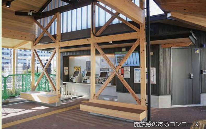
開放感のあるコンコース