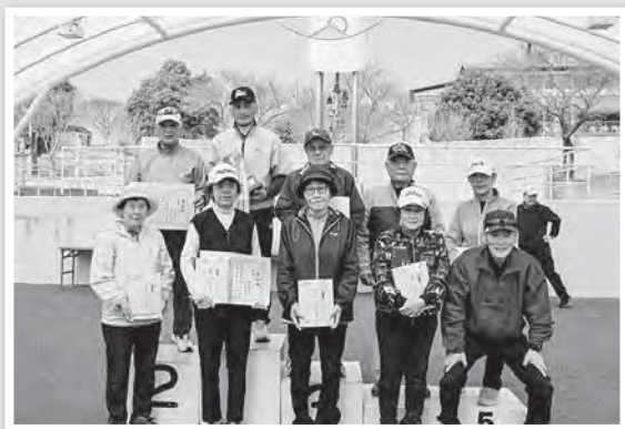
受賞ペアの皆さん

今大会はペアマッチということで、男女がペアを組み、ティーショット(1打目)を男女とも打ち、その後男女どちらかのボールを選択して男女交互に打っていくというルールで行われました。このため多くのペアが、1人は一か八かでホールインワンを狙い、もう1人が着実にフェアウェイをキープするという作戦を取ったようで、普段より多くのホールインワンが飛び出しました。