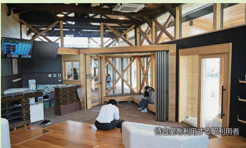
待合室を利用する駅利用者