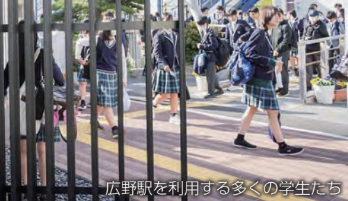
広野駅を利用する多くの学生たち