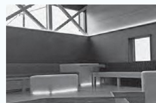
広野駅交流施設の様子