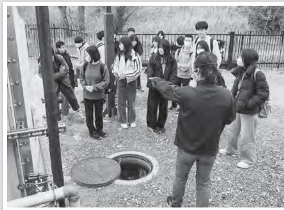
地中熱エネルギーの説明

当日は、バナナ栽培で活用している『地中熱エネルギー』の仕組みや活用方法を座学で説明した後、実際にバナナハウスを見学していただきました。生徒たちは事前に地中熱エネルギーについて調べて来ており、質問タイムでは多くの質問が寄せられ、活発な意見交換が行われました。生徒の皆さん、遠方よりお越しいただき、ありがとうございました。