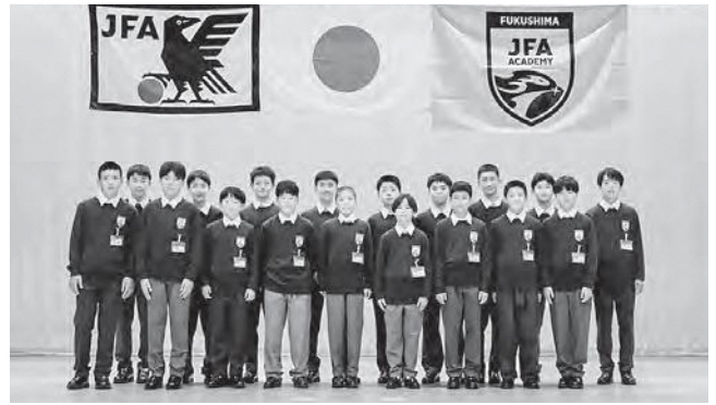
↑ 入校式に出席した21期生の生徒たち