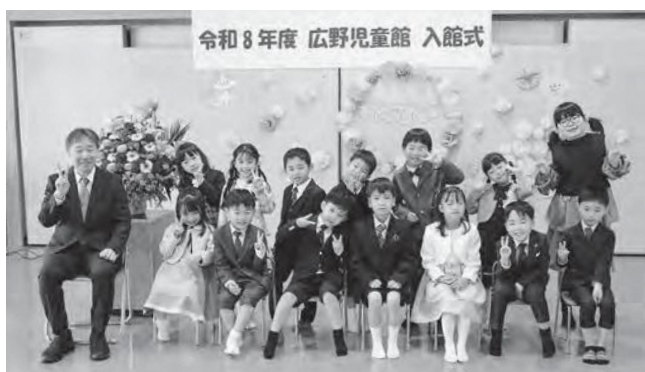
↑入館式に出席した児童たち

新年度を迎え、児童館では入館式を行いました!少し緊張しながらも、名前を呼ばれると大きな声で元気にお返事ができました。