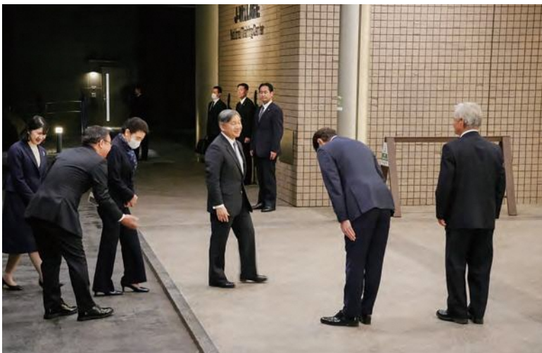
Jヴィレッジに到着された天皇、皇后両陛下と愛子さま