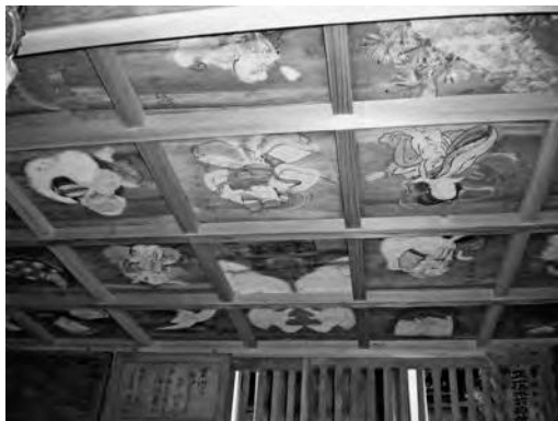
写真上：水前稻荷神社拝殿 下：拝殿の天井絵