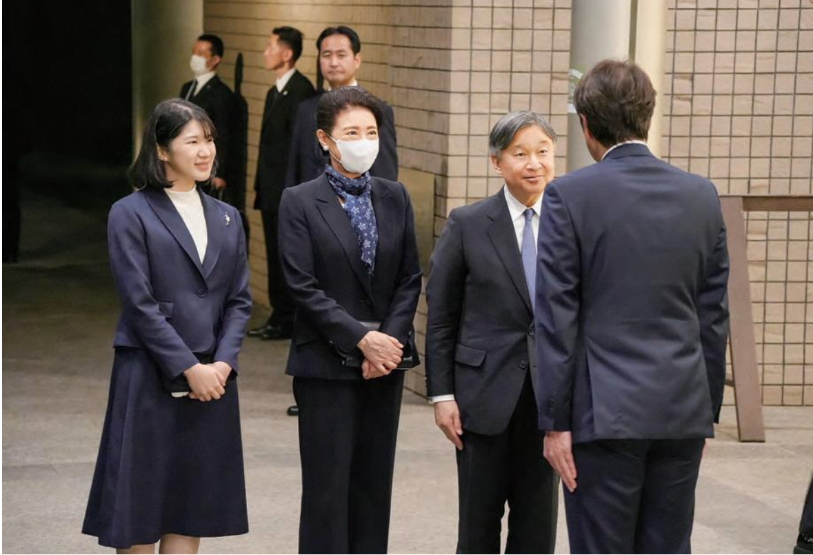
小松町長と言葉を交わす天皇ご一家