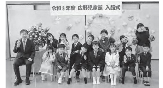
↑ 入館式に出席した児童たち

新年度を迎え、児童館では入館式を行いました!少し緊張しながらも、名前を呼ばれると大きな声で元気にお返事ができました。これから児童館の生活で、遊びや活動を通して、さまざまな経験をします!その中で友だちとの関わりを深めながら、楽しく過ごしていきたいと思えます。子どもたちの成長を見守りながら元気に過ごしていきたいですね!