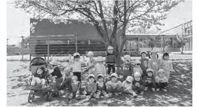
↑ 園庭の桜の木の前で記念撮影

やわらかな陽ざしに包まれ、新年度が始まりました。桜のお花がとってもきれいに咲いた園庭で、素敵な笑顔を見せてくれる子どもたち。入園や進級当初はちょっぴり緊張している子もいましたが、今では園生活にも少しずつ慣れてお散歩に出かけたり、お外では草花や虫探しに夢中!元気にいっぱい遊んで過ごしています!今年1年間、こども園での行事がたくさん待っています。新しいクラスでの楽しい体験を重ねて、心も体もますます大きく成長していく姿を楽しみにしています。