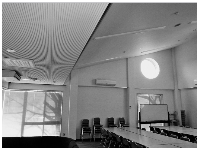
合宿の宿 きれいになった食堂の壁の様子

実際工事に入っていないと分からなかったものが一方、機器の最終的な仕様の確定が受注者とできていなかった部分もありました。