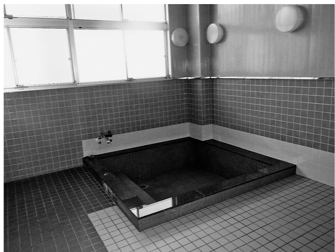
合宿の宿 きれいになった浴槽の様子

工事名称 合宿の宿維持補修工事 工事場所 下北迫字大谷地原地内 工期 着工 令和7年9月10日 完成 令和8年3月31日 契約金額 8525万円(変更前) 8973万円(変更後) 受注者 西本建設株式会社