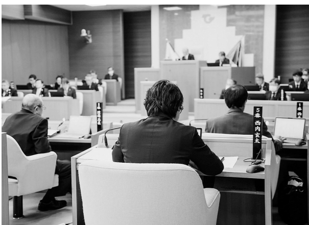
議会でのタブレットPC活用の様子