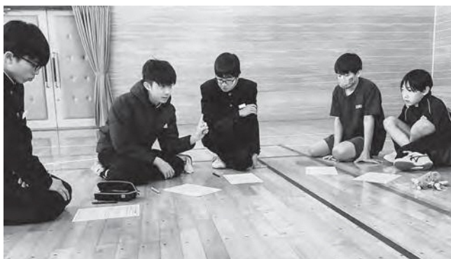
↑ いじめの問題について真剣に考える生徒たち

1月14日（水）、第3回いじめゼロ運動全校集会を開催しました。広野中学校では3年前より「いじめゼロ運動」を実施しています。第1回集会では、今年度のキャッチコピーなどを決定し、第2回集会では、生徒会役員を中心に啓発ポスターの制作などを行いました。今回は1年間の活動を振り返り、どのようなことを意識して生活したか、来年度はどんな活動をしたいかなどを全学年の生徒で話し合いました。