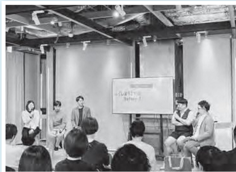
移住セミナー風景