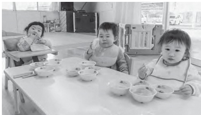
↑ 楽しく給食を食べる園児たち

笑顔が可愛い0歳児3名のすみれ組！4月に入園し、給食を通してお野菜やお肉、お魚をモリモリ食べられるようになり、たくさんの食材に触れてきました。給食は子どもたちにとって、大切な時間の一つです。掴み食べから、今ではスプーンを一人で持ち、自分で食べようとする意欲的な姿が見られます。個々の思いを尊重し、「おいしいね」と声をかけながら食事を楽しんでいます。