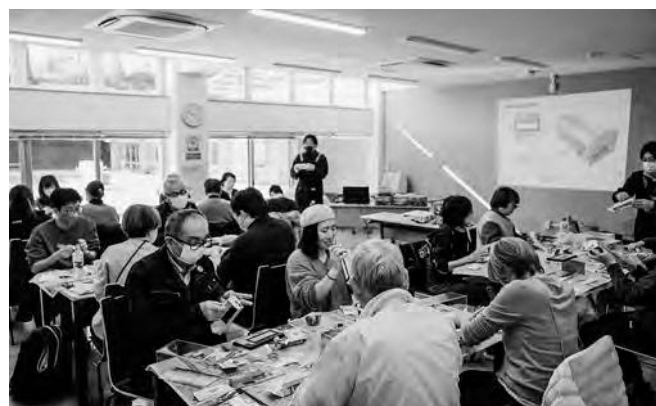
↑ 楽しみながら作業を行う参加者の皆さん

ペーパークラフトワークショップが1月24日(土)にひろの未来館で開催されました。このイベントは「地域の記憶継承プロジェクト」と題して、長年親しまれてきた広野駅の旧駅舎の思い出を大切にするため開催されました。当日は町民約20人が参加して、旧駅舎の思い出を語り合いながら、3Dプリンターで再現した駅舎のペーパークラフトを手作業で丁寧に組み立てました。