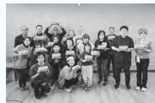
ペーパークラフトワークショップの様子