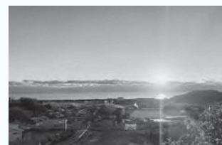
みかんの丘から見た初日の出

24日は、現在改修中である旧広野駅舎をモデルにしたペーパークラフトワークショップに参加しました！ 旧広野駅舎は交流施設に生まれ変わり、3月に完成予定です。みなさんも広野駅へ足を運んでみてください！