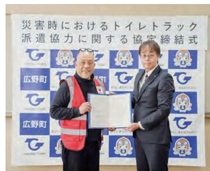
協定締結式の様子

あなたの写真が広報ひろのに載っていたら、総務課の窓口でお渡しできます。お気軽にお問い合わせください。