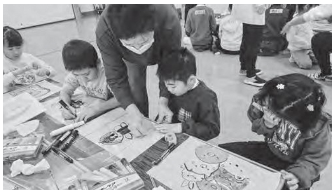
↑ 老人クラブの皆さんと交流した子どもたち

老人クラブのみなさんと一緒に凧作りを行いました。竹ひごを付けたり、穴をあけてタコ糸を通したり、老人クラブの方々に教えていただきながら作り上げていきました。あいにくの天気でお外に出て上げることはできませんでしたが、後日「お正月に家で凧上げしたよ！」という話も聞けました。活動を通して地域の方とのあたたかい交流ができたことは、子ども達にとって貴重な経験となりました。