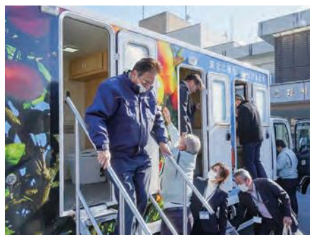
お披露目されたトイレトラック

広野町では、災害時の安心・安全な衛生環境を確保するため、車両にトイレが搭載された「トイレトラック」を導入しました。トイレトラックには洋式便器の個室トイレが5室あり、1室には乗降装置が付いていて車椅子でも利用が可能です。導入にあたっては、一般財団法人助けあいジャパンと「災害時におけるトイレトラック派遣協力に関する協定」を締結し、全国の参加自治体が支援し合う仕組み「災害派遣トイレネットワーク」に加盟しました。トイレトラックは今後、災害時のほか防災訓練やイベント会場などで活用していきます。