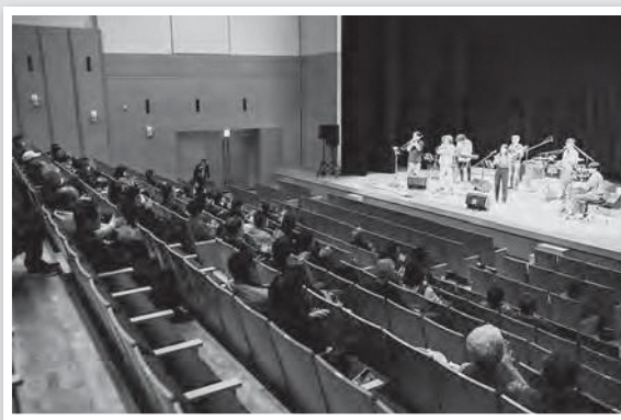
富岡町での開催の様子