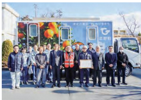
お披露目式の様子