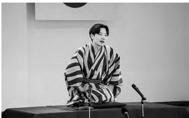
↑ 巧みな話芸で会場を沸かす学生

東京大学落語研究会による寄席が1月24日（土）に広野町公民館で開催されました。このイベントは東京大学アイソトープ総合センターと福島工業高等専門学校の主催で、学生が落語や漫才、言葉のワークショップなどを通して、古典や言葉の魅力を伝える取り組みです。寄席では8人の学生たちが落語や漫才を披露し、その巧みな話芸で会場を沸かし、来場した町民の皆さんも声を上げて笑っていました。