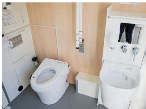
衛生的な車内の個室トイレ

広野町では、災害時の安心・安全な衛生環境を確保するため、車両にトイレが搭載された「トイレトラック」を導入しました。トイレトラックには洋式便器の個室トイレが5室あり、1室には乗降装置が付いていて車椅子でも利用が可能です。導入にあたっては、一般財団法人助けあいジャパンと「災害時におけるトイレトラック派遣協力に関する協定」を締結し、全国の参加自治体が支援し合う仕組み「災害派遣トイレネットワーク」に加盟しました。トイレトラックは今後、災害時のほか防災訓練やイベント会場などで活用していきます。