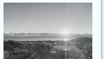
みかんの丘から見た初日の出

24日は、現在改修中である旧広野駅舎をモデルにしたペーパークラフトワークショップに参加しました！旧広野駅舎は交流施設に生まれ変わり、3月に完成予定です。みなさんも広野駅へ足を運んでみてください！