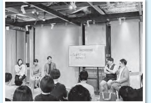
移住セミナー風景