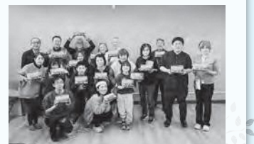
ペーパークラフトワークショップの様子