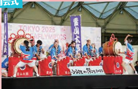
Jヴィレッジでのサテライト開会式・太鼓演奏