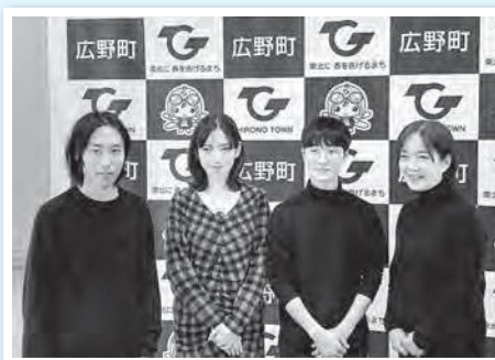
4名のアーティスト

令和5年度のテーマは「鳥小屋」、令和6年度は「奥州日之出の松」、そして今年度のテーマは「高倉山」です。今年度は審査を通過した4名のアーティストを招き、3月中旬まで広野町に定期的に滞在していただきます。アーティストは広野町の歴史・風土・文化をリサーチしながら、町民の皆さまと協働し、「高倉山」をテーマにした作品を創作します。「りんくひろの」は、アーティストの活動をサポートしてまいります。