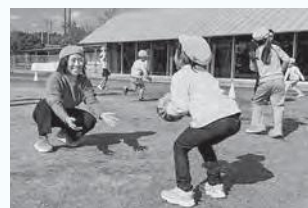
スポーツ教室の様子