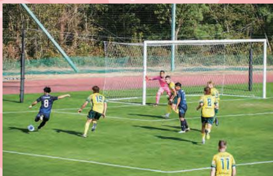
グループステージ・オーストラリア戦