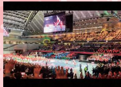
東京体育館での開会式・日本選手団入場