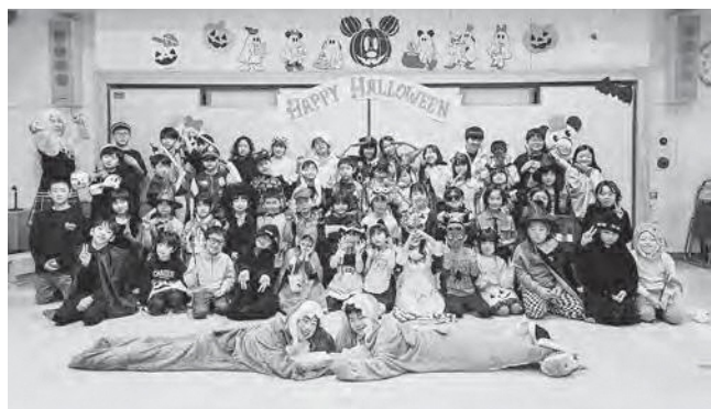
↑ 様々な仮装でハロウィンパーティーを楽しんだ子どもたち

10月31日(金)、ハロウィンパーティーを行いました。様々な飾りでハロウィン色館内、好きなキャラクターや魔女など様々なコスチュームに仮装したりメイクをした子どもたち、職員のオープニングダンスで幕開けし、お菓子すくいやコインゲーム、ボール落としなどのゲームを楽しんだり、大縄跳びやつな引きをして盛り上がりました。また、帰りには『Trick or Treat🍬』とお菓子をもらったり、フォトスポットで写真を撮ったり、笑顔の絶えない楽しい時間を過ごすことができました。