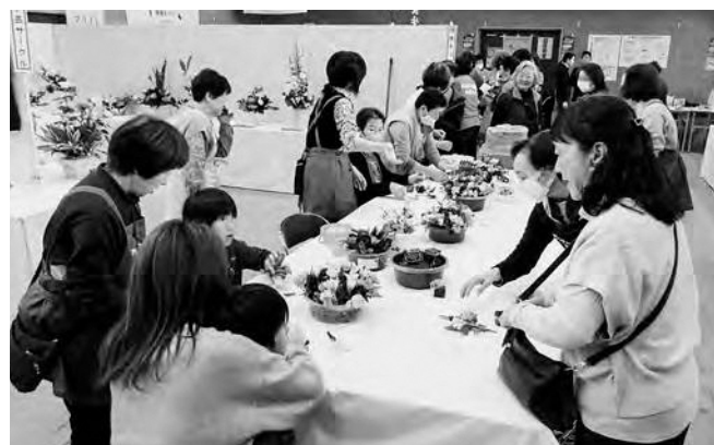
↑ 多くの来場者で賑わう実演コーナー

令和7年度広野町文化展が11月1日（土）と2日（日）の2日間、広野町中央体育館で開催されました。文化展には文学・美術・趣味の各部門において、広野俳句会や静抄サークル、華道教室など広野町文化協会に加盟している各種団体の作品が数多く展示されました。また、こども園、小・中学校、ふたば未来学園の児童・生徒の作品も展示され、来場者は創意工夫のこもった作品の数々を楽しみながら鑑賞しました。会場では、折り紙やアレンジメントフラワーなどの実演コーナーや、茶道みどり会による呈茶コーナーが設けられ、会場は多くの来場者で賑わいました。