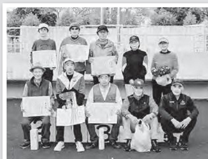
オープン記念受賞者の皆さん