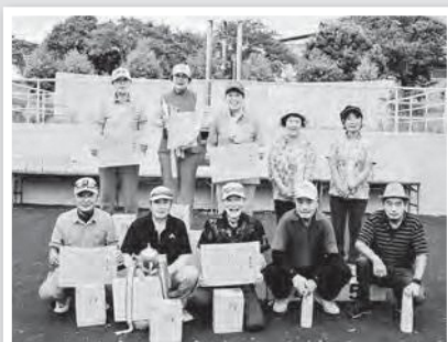
ひろのカップ受賞者の皆さん