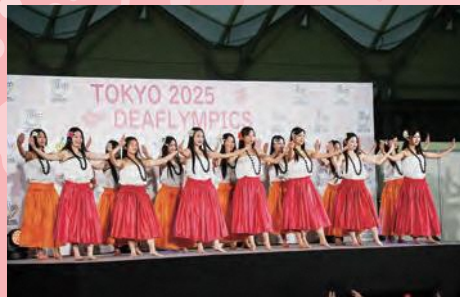
Jヴィレッジでのサテライト開会式・高校生フラダンスショー