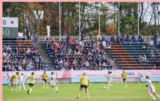
グループステージ・オーストラリア戦