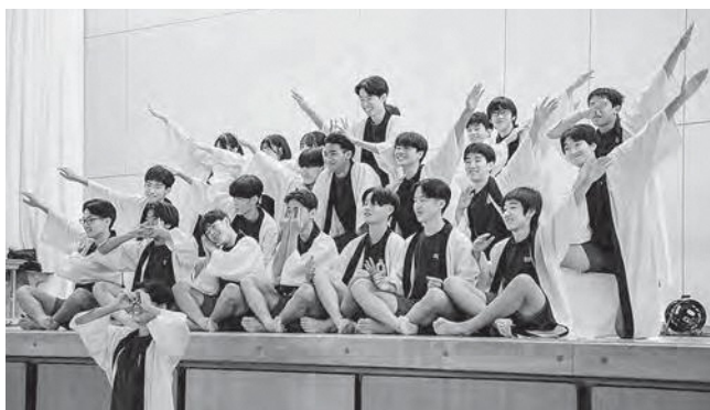
↑ 全校生による息の合った迫力ある広中ソーラン

10月31日(金)、第28回広蛸祭を開催しました。今年のテーマ「START～踏み出せ一歩～」、開祭式では3学年が心を一つにした広野昇龍太鼓の演奏を披露しました。学年発表では、1年生が「私が町長だったら～TV Show～」で広野町への政策をユーモアを交えて提案しました。2年生は職場体験から「働くこと」を考え、「千と千尋の神隠し」に乗せてSDGsとの関わりを発表しました。3年生は集大成として「ドラゴン桜」に乗せ、広野と共生社会を考察しました。最後は、全員の力を合わせた広中ソーランの力強いかけ声と息の合った動きで感動的に閉幕しました。生徒たちへの温かいご声援ありがとうございました。