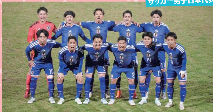
男子日本代表の選手たち