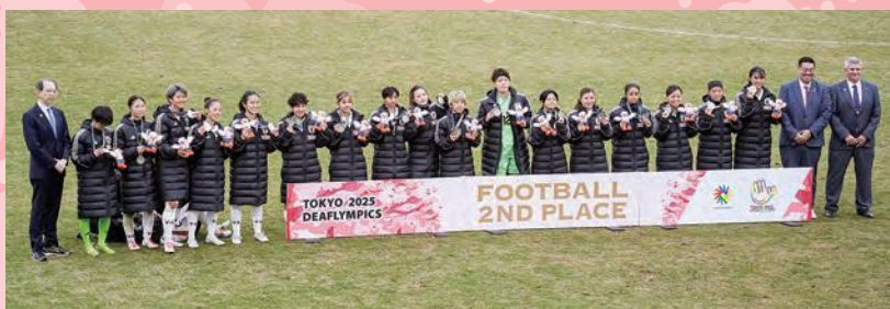
銀メダルを獲得した女子日本代表