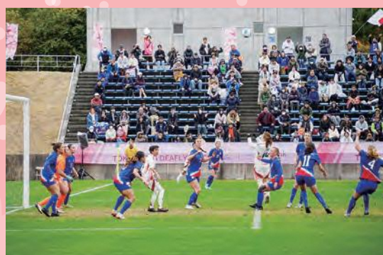
決勝・アメリカ戦