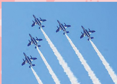
アクロバティックな飛行を披露 町内上空を飛行する ブルーインパルス