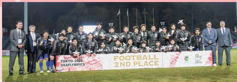
銀メダルを獲得した男子日本代表