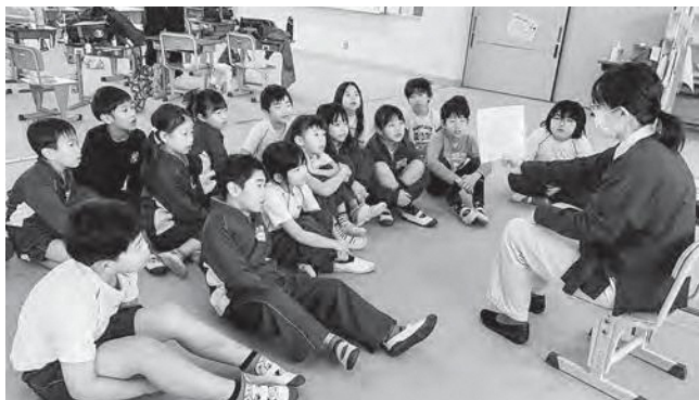
↑ 本の世界に引き込まれる児童たち

先日、司書の先生による「お出かけ読書タイム」が2年生を対象に実施されました。広野小学校では、子どもたちが読書に親しみ、その楽しさを知るための活動を積極的に行っています。今回は、絵本「ぜったい たべないからね」の読み聞かせが行われました。子どもたちはグイグイと本の世界に引き込まれ、読み聞かせの後は、絵本の内容に関する楽しいクイズも出題され、目を輝かせながら答える姿が見られました。読書の楽しさに夢中になる児童たちの、素敵な時間となりました。