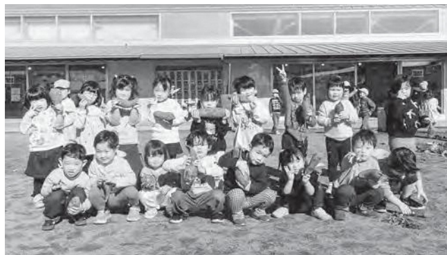
↑ さつまいもの収穫を楽しんだ園児たち

お天気に恵まれた青空の下、こども園で育てた、さつまいもの収穫をしました。収穫の前に子どもたちは、「大きなさつまいもあるかな?」「いっぱい掘るんだ!」と意欲的!子どもたちが自分の手で土を掘り起こし、さつまいもを見つける過程は、まるで宝物探し!お友達と一緒に夢中で掘っていました。掘ったさつまいもを見て、「たくさんさつまいも採れたよ」「大きくてびっくりした」など、子どもたちの驚きや発見の声が聞こえてきました。苗から育てたさつまいもが大きく育ち、収穫できた喜びを感じた日となりました。