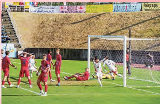
ノックアウトステージ(準々決勝)・イギリス戦