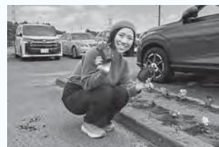
花いっぱい運動の様子