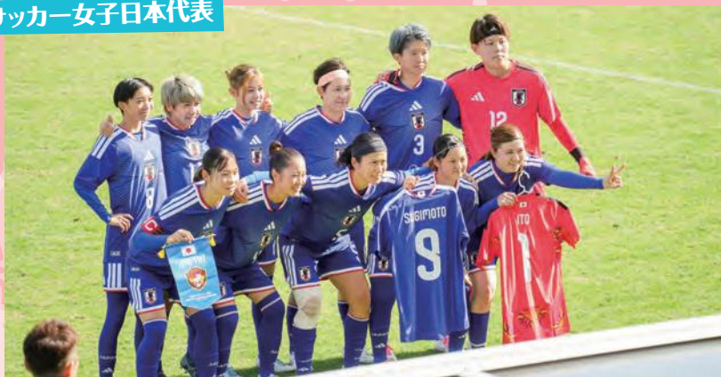
女子日本代表の選手たち