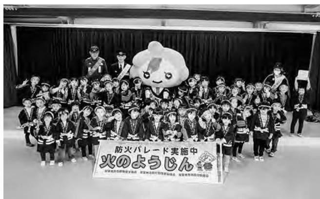
↑ 防火パレードに参加したこども園の園児たち

広野こども園幼年消防クラブ防火パレードが11月11日（火）、広野駅前通りで行われました。この活動は秋の全国火災予防運動の一環として行われ、パレードには広野こども園の3歳児から5歳児の園児62名と広野町消防団・婦人消防隊、富岡消防署樫葉分署、双葉警察署の関係者らが参加して「火の用心」を呼びかけました。お揃いの法被を着た園児たちは駅前通りを拍子木を鳴らしながら元気いっぱい声を出して練り歩きました。パレード終了後にはこども園において終了式が行われ、秋田団長らから園児たちへ記念品の贈呈が行われました。