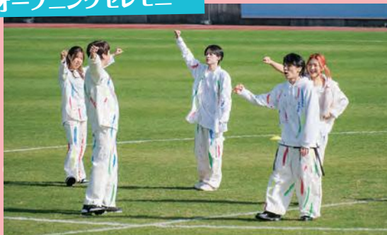
ボーカル＆手話パフォーマンスユニットHANDSIGN