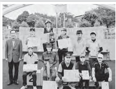
レッドカップ受賞者の皆さん