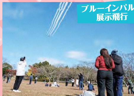
ブルーインパルス 展示飛行