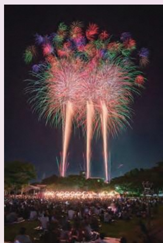
福島民友新聞社特別賞 (tomo_photography14)