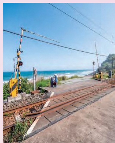
福島民報社特別賞 (ru_ei4110)