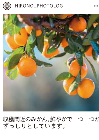
収穫間近のみかん。鮮やかで一つ一つがずっしりとしています。