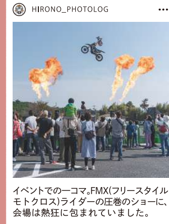
イベントでの一コマ。FMX(フリースタイルモトクロス)ライダーの圧巻のショーに、会場は熱狂に包まれていました。