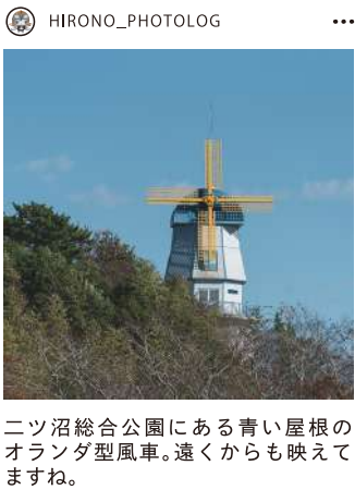
ニッ沼総合公園にある青い屋根のオレンジ型風車。遠くからも映えますね。