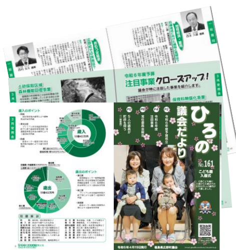
広野議会だより161号

町民の皆様と議員が意見交換をします。議会や町政に対し、日頃感じている事など、町民の皆様の声をお聞かせください。