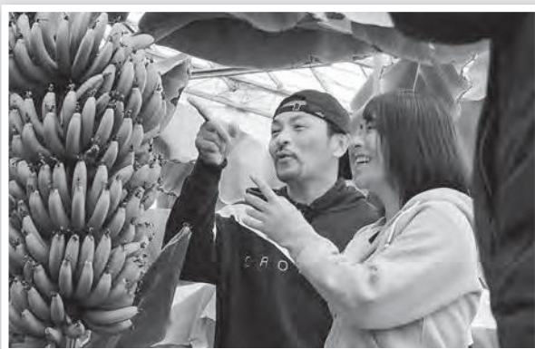
出演者は台湾で活躍する日本人です