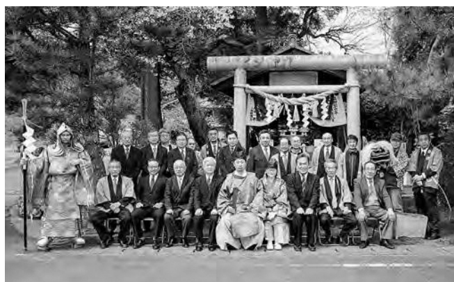
↑大滝神社例大祭に出席した関係者の皆さん

鹿島神社と大滝神社の両神社において、4月7日（日）、春季例大祭が執り行われました。広野町では、浅見川の下流域にある男神の鹿島神社の神輿と、上流域にある女神の大滝神社の神輿が町内で合流し、浅見川河口で身を清め五穀豊穰を祈る神事（浜下り神事）が行われていますが、今年は神事のみが執り行われました。鹿島神社では境内に神輿を鎮座させ、氏子らが祈りをささげました。大滝神社では長畑お借宿において神事を行い、氏子らが玉串をささげました。