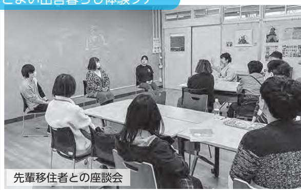
先輩移住者との座談会

広野町移住定住事業の一環である「インターン地域交流活動支援事業」が3月21日（木）の成果報告会をもって無事終了いたしました。約1か月間、全国から選出された学生6名が町内企業3社にインターンとして入り活動しました。企業の課題解決に向けて学生たちが町内で情報収集し調査したものをまとめ、企業への提案資料として成果報告会で発表しました。発表内容は箒平地区までドローンを飛ばすための課題解決やゼロカーボンを達成させるための取組、キッチンスタジオの利用促進など様々でした。今後も学生たちが広野町に継続して足を運び、関係人口として繋がりが継続していくような取り組みができればと思います。