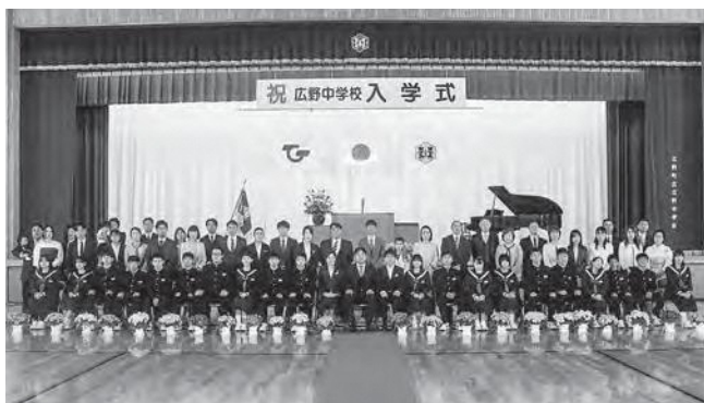
↑新入生・保護者さん、担任・校長先生で撮影した集合写真

令和6年度広野中学校入学式が4月8日(月)に中学校体育館で行われました。今年度は地元広野小学校出身の21名、県外から1名、将来プロサッカー選手になることを目指して全国各地からJFAアカデミー福島に集まった18名の計40名が入学しました。予報では雨の可能性がありましたが、皆さんの願いが通じ、心地よい天気なかで式典が執り行われました。在校生は式前に会場準備や歌練習、心構えの確認が行われ、しっかりとした態度で臨み、新入生は、当然ながら緊張が見られましたが、堂々とした姿勢で式に参加し、最後まで広野中学生としてやり切りました。