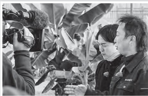
取材を受ける幸森部長