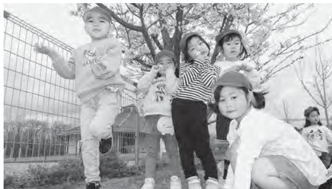
↑お花見をするさくら組の子どもたち

満開に咲く桜の木の下でお花見をしながら、戸外遊びを楽しみました。暖かい日差しの中、自然に触れたり、遊具や鬼ごっこをしたりしながら遊びました。