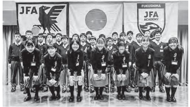
↑入学式に出席した19期生の生徒たち