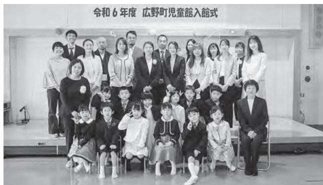
↑元気いっぱいの新入館児童です

4月8日(月)、新入館児童13名の入館式が行われ、63名でスタートしました。1年生は一週間が過ぎた頃には、すっかり児童館での生活に慣れ、友だちや先生に笑顔で元気にあいさつができるようになりました。児童館では宿題をしたり、美味しいおやつを食べたり、お友だちとたくさん遊んだり…楽しい毎日をご過ごしていきたいです!