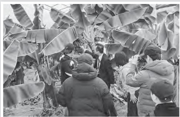
取材クルーの皆さん

4月3日に台湾東部で大地震が発生したのは皆様もご存知のとおりです。取材クルーの安否を心配しましたが、全員無事とのことでした。この地震で亡くなった方々に衷心よりお悔やみを申し上げますとともに、被災した方々へお見舞い申し上げます。そして一日も早い復旧・復興を願っております。