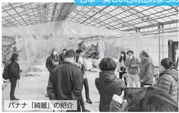
バナナ「綺麗」の紹介