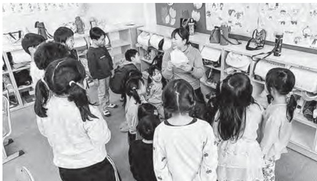
↑先生から学校生活のいろはを教えてください新入生児童

広野小学校では入学式、始業式を終え、本格的に学校が始まりました。1年生は基本的な学校生活のオリエンテーションから始まり、2年生～6年生は通常授業が始まりました。学期はじめは新しい学年での心構えや1学期の目標などを各学年で設定しました。新入生はこれから初めて尽くしの学校生活が始まるのもあってか、ワクワク・ドキドキ胸一杯の様子で活動していました。広野小学校の児童生徒がこれからどのように今年1年過ごすのかとても楽しみです。