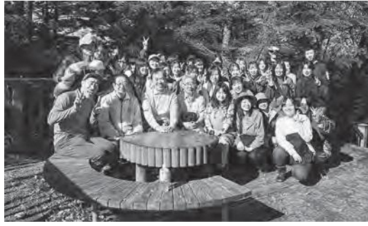
五社山・高倉山トレッキングモニターツアー

を募り「五社山・高倉山等を活用した情報発信事業モニターツアー」を開催しました。広野夢大使であるタレントのなすび様や関係者を含め51名が参加し、五社山・高倉山登山、町内の散策やワークショップをとおして町の魅力を発信し交流を深めました。