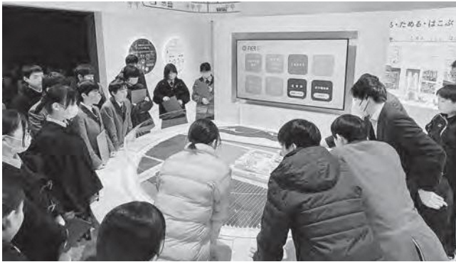
↑説明を聞く生徒たち

ふたば未来学園中学2年生が12月1日（金）、イノベーション・コースト構想について学ぶ体験ツアーを行いました。楡葉町にある遠隔技術センターでは、高さ40mもある大きな実験棟を見学したり、VRを用いて原子炉建屋の状況を見させていただきました。浪江町にある水素エネルギー研究フィールドでは、現状のエネルギー問題や水素の活用方法について学びました。福島で学ぶ生徒として未来について考える機会となりました。