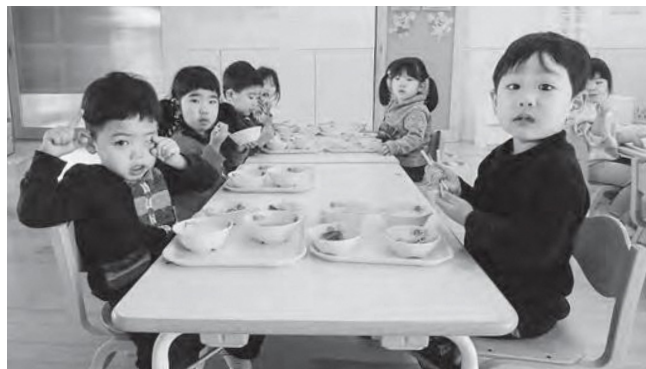
↑給食が大好きな子どもたち