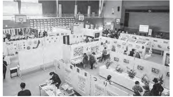
ひろの秋祭り「文化展」

くの作品が出品され、約1,000名の来場された皆さまにご観覧いただきました。また、広野町文化協会へ加盟している団体による体験コーナーが設けられ、呈茶や折り紙・アレンジメントフラワーを体験しました。