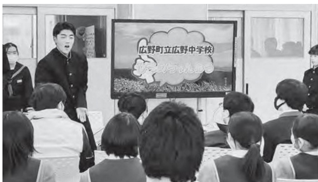
↑地域研究について発表する様子

双葉郡8町村の小学校・中学校・義務教育学校・ふたば未来学園中学校・高等学校が取り組む「ふるさと創造学サミット」が12月2日(土)、ふたば未来学園で開催されました。テーマや活動内容は学校の特色をねらい、子どもたちの実態に応じて各校で設定し、総合的な学習の時間を中心に進められています。広野中学校は今年の地域研究について発表しました。3年生を中心にアドリブを交えながら素晴らしい発表をしました。