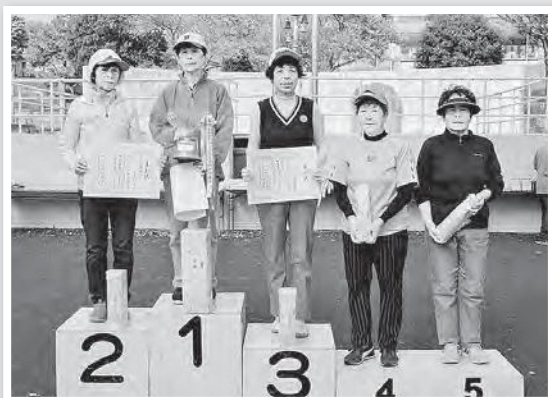
女性の部入賞者の皆さん

11月5日(日)、ニツ沼総合公園パークゴルフ場に於いて、「第9回ニツ沼総合公園パークゴルフ場オープン記念大会」を開催しました。今大会は第9回となっていますが、これは先の震災後再開してからの回数です。