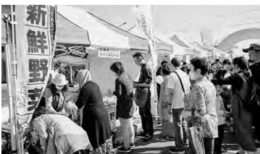
ひろの秋祭り「収穫祭」

11月3日、広野町公民館駐車場において、秋の風物詩となるひろの秋祭りの一環として、農業団体、商業団体などのご協力により収穫祭を開催しました。新型コロナウイルス感染症の影響により4年ぶ