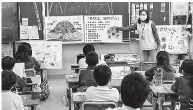
↑森林教室のようす

森の案内人2名と役場の関係者をお招きし、3年生が森林教室、6年生が木工教室を行いました。3年生の森林教室では、森林の働き方や森と人との深い関係を分かりやすく教えていただきました。6年生の木工教室では、様々な用途の折りたたみ式の椅子を作りました。