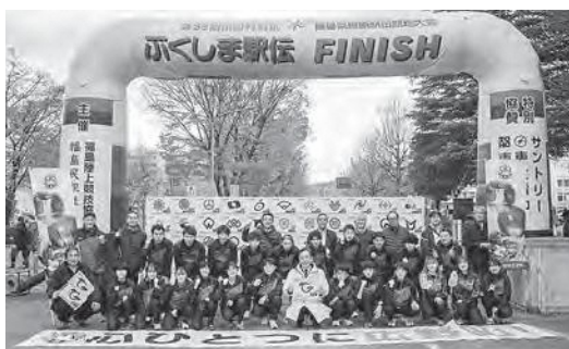
第35回ふくしま駅伝

11月19日、第35回市町村対抗福島県縦断駅伝競争大会(ふくしま駅伝)が、白河市総合運動公園陸上競技場をスタートし、福島県庁をフィニッシュとする16区間、96.3キロメートルで繰り広げられました。日頃の練習の成果を発揮され無事完走し、総合成績においては51チーム中、19位、町の部においては28チーム中、7位となり、町の部において5年連続、6度目の入賞を果たしました。