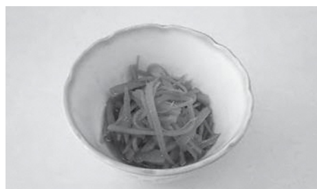
エネルギー 40kcal 塩分 0.7g (1人分)