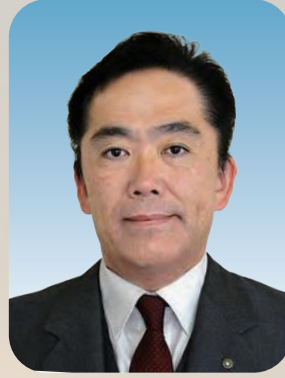
広野町長 遠藤 智

謹んで新年のごあいさつを申し上げます。 年頭に当たり町民の皆様には、今年一年のご健勝とご多幸を心よりお祈り申し上げますとともに、町政全般にわたり深いご理解と温かいご支援を賜り、心より感謝申し上げます。