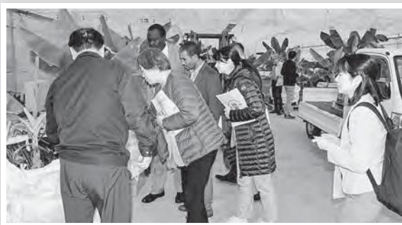
地中熱エネルギーの説明

11月18日(土)、JICAの方々がトロピカルフルーツミュージアムへご視察にいらっしゃいました。通訳がお一人で、他は皆さん海外の方だったので、英語で通訳されていました。時折専門用語が訳せず、こちらも違う言葉で説明するのに若干苦勞しましたが、様々な質問を受け有意義な時間を過ごせました。ウクライナの方がお二人いらっしゃったので、「We stand by you.」と片言の英語で話したら「Thank you.」と答えて頂きました。