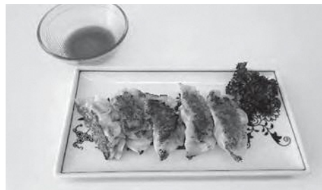
エネルギー 220kcal 塩分 0.7g (1人分)