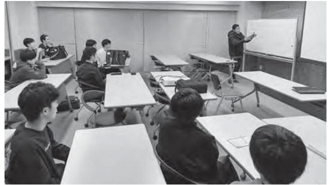
↑指導者の話を真剣に聞く選手たち