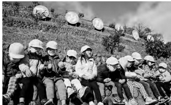
↑ みかん狩りを楽しむ子どもたち

広野町のみかん畑「みかんの丘」で12月7日(木)、毎年恒例のみかん狩りが行われ、広野こども園の約60名の子どもたちがみかん狩りを楽しみました。参加した子どもたちは冬晴れの暖かな日差しの下、豊かに実ったみかんを摘み取り、美味しく味わいました。広野町は温暖な気候をPRするため、1985年にみかんの苗木を町内全戸に配布するなど、みかんを活用したまちづくりを進めており、今後は新たな加工品として、みかんを使ったワインの試作などにも取り組んでいきます。