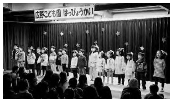
広野子ども園発表会

9月24日、広野町総合グラウンドにおいて、佐々木恵寿福島県議会議員を始め多くの来賓のご臨席をいただき、令和5年広野町消防団・婦人消