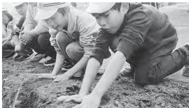
↑球根を植える子どもたち

12月の中旬、児童館の花壇にみんなで球根を植えました。球根をそっと土の中に入れ、優しく土をかけてくれた子どもたち。「何色の花が咲くかな?」、「何て名前の花?」と興味を持ち楽しく行うことができました。チューリップやヒヤシンス、フリージア、色とりどりの綺麗な花が咲くのが楽しみです!!