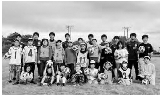
JFAアカデミー福島「キッズプロジェクト」

巡回し、外で遊ぶことが減った子どもたちにサッカーを楽しむ時間を提供することで健康な身体づくりに資することを目的としており、今後も継続的に開催されることとなっております。