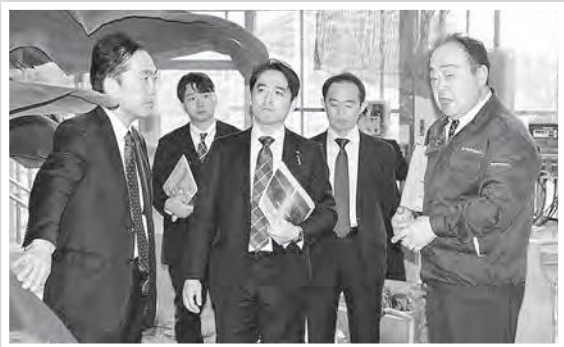
遠藤町長も交えて説明

10月31日(火)、平木大作復興副大臣他3名様がトロピカルフルーツミュージアムへご視察にいらっしゃいました。東北の地福島でのバナナ栽培について、地中熱エネルギーを利用した栽培についてお話しをさせていただき、ニツ沼総合公園名物のバナナシェイクも味わっていただきました。