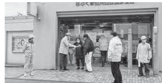
金融機関利用者に呼びかける防犯指導隊員