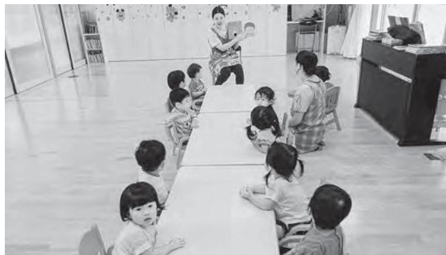
↑絵本が大好きな子どもたち

こども園では毎日絵本の読み聞かせを行っています。繰り返しのことばやしかけのあるもの、先生からの問いかけと一緒に考えたり、毎回楽しみにしている子どもたちです。絵本を通してイメージを膨らませたり季節感を味わったりしながら、絵本を好きになるきっかけ作りをしていきたいと思えます。