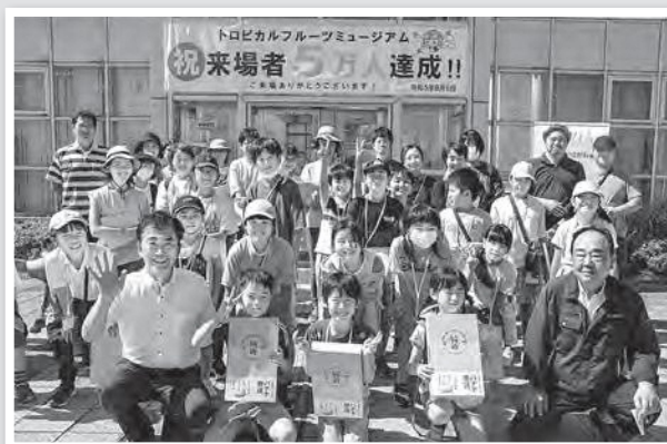
5万人記念のご来場グループ

2018年から新たな取り組みとして熱帯フルーツの栽培を始め、2019年から広野町産バナナ「朝陽に輝く水平線がとても綺麗なみかんの丘のある町のバナナ」(愛称「綺麗」)の出荷を開始することができ、今ではバナナジュースやシェイクの販売、福島県立ふたば未来学園の生徒たちと協力して「ふたばななクッキー、未来ドーナツ、学園マドレーヌ」の通年販売、バナナの葉を活用した卒業証書の作成などにも取り組んでいます。トロピカルフルーツミュージアムでは、バナナが実際になっている光景や栽培方法の講演、収穫時は緑色のバナナがムクのなかで熟成されていく様子を、これまで数多くの皆さまに見学していただきました。今後もこういった取り組みを継続していくことで、広野町を訪れてくれる人を一人でも増やし、町の活性化や魅力向上に努めて参ります。