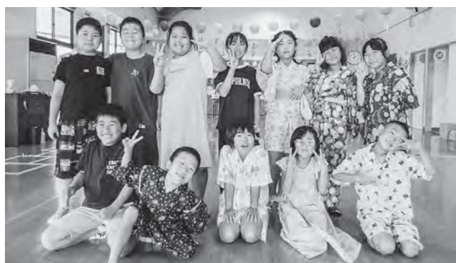
↑夏まつりを楽しんだ子どもたち

子どもたちが心待ちにしていた夏休み！児童館では毎年恒例の夏祭りを行いました。スーパーボールすくいや水中コイン落とし、椅子取りゲームなどいろいろなゲームに参加した子どもたち、高学年を中心に各チームが協力しました。写真は元気いっぱい3年生です！子どもたちは楽しかったと大満足、また一つステキな思い出が増えました。