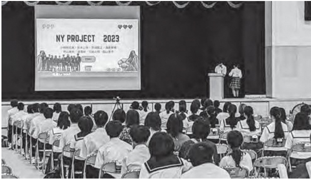
↑ 1日体験入学の様子

ふたば未来学園高校一日体験入学を7月28日（金）に開催しました。毎年多くの中学生が参加しており、体験授業では理科の実験などを行い、スペシャリスト系の授業では、専門分野に分かれて制作体験を行いました。また、トッパスリート系の授業ではサッカーや野球など実技体験を行うなど今回もふたば未来学園らしい学びの一部を体験することができました。体験を通して中学生の皆さんの進路の一助になることを期待しています。