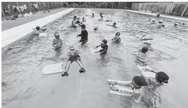
↑浮き方を学ぶ生徒たち

日本水難学会講師を招いての着衣水泳の講習会を7月14日(金)に実施しました。万が一、川に落ちたり、海で波にさらわれたりした状況の中でどうすればよいかを教えてくださいました。服や靴を履いたままの状態だと普段と勝手が違い、身動きが取りづらいなど違いがあり、そうした中で空のペットボトルなどを使用した浮き方を学びました。こうした対処方法を経験することで水難事故が減少することを願うばかりです。