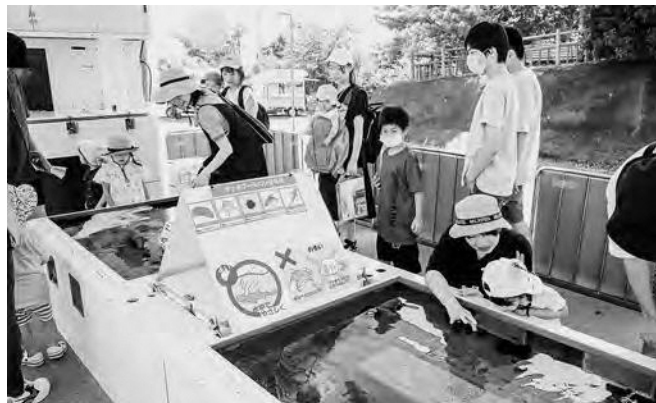
↑ 展示されている生物を観察する参加者

いわき市のアクアマリンふくしまで展示されている生き物を見学できる「ひろの移動水族館」が7月29日（土）と30日（日）、ひろの未来館で開催されました。移動式の水槽には、ヒトデやウニ、ナマコ、イセエビなどが展示され、参加した子どもたちは歓声を上げながら、水の中に手を入れて海の生き物に触れていました。当日は化石発掘体験や勾玉づくり体験なども行われ、2日間で約300名が来場し、親子連れで賑わいました。