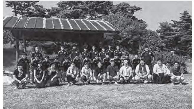
↑ サポートファミリーの皆さんと記念撮影