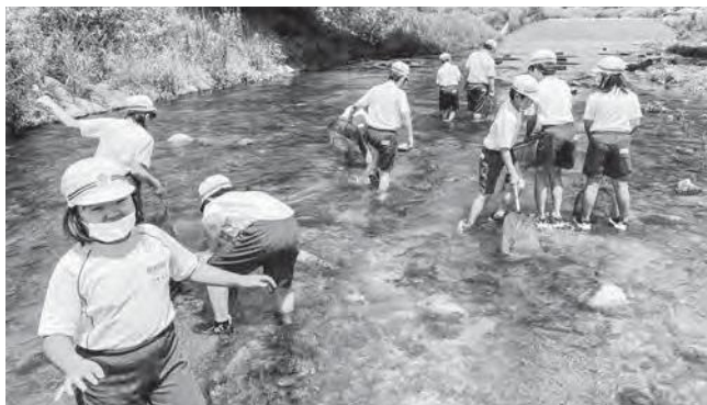
↑浅見川で調査をする生徒たち

4年生の総合学習で浅見川の自然探索を7月3日(月)に行いました。NPO法人浅見川ゆめ会議の方々に協力していただき、実際に子供たちが川に入り、生息するいろいろな種類の生き物を確認することができました。中には初めて見る生き物にびっくりするなど広野町の自然の豊かさを感じることができる学習になりました。