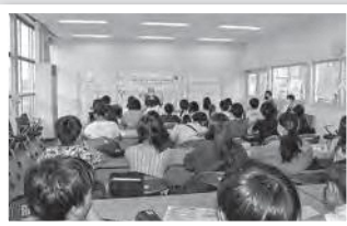
開智望小の皆さん

7月5日（水）、千葉県に本社があるイオンコンパスというイオングループの旅行会社の方々が見学に訪れました。町民としても公社としても大変お世話になっているイオングループさんです。質問の目の付け所が普通と違って、説明するこちらも楽しかったです。