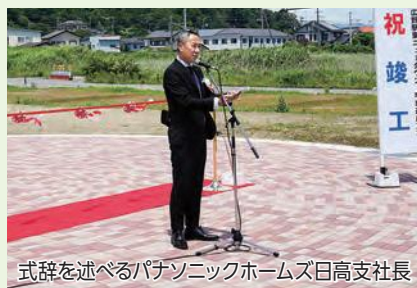
式辞を述べるパナソニックホームズ日高支社長

住宅用地は約1.8haの敷地に47区画を整備しており、町民の方はもちろん、移住者の方や子育て世代の方が安心して生活できる住環境を提供していきます。