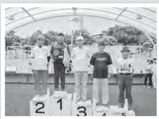
男性の部受賞者の皆さん