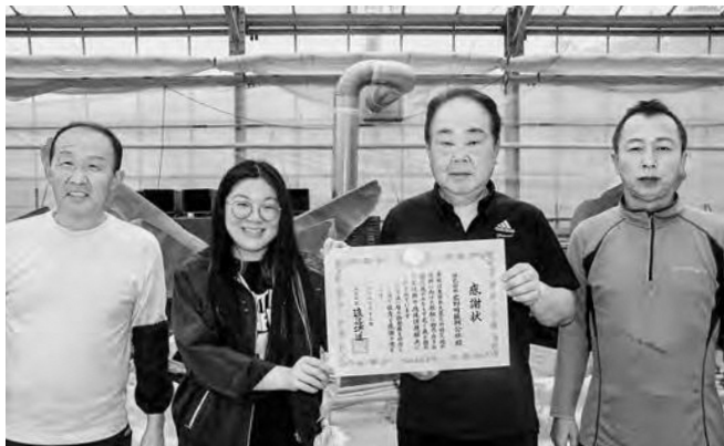
↑ 感謝状の贈呈を受けた中津社長(右から2番目)と職員の皆さん