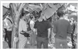
イオンコンパスの皆さん