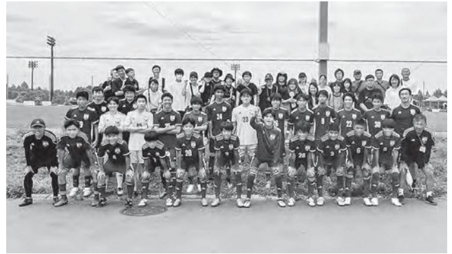
↑ 全国大会出場を決めた選手たち