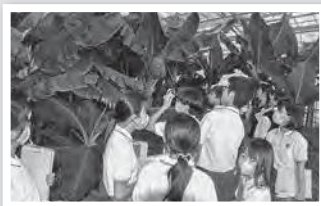
ふたば未来学園の皆さん