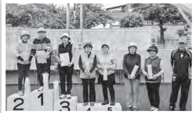
女性の部受賞者の皆さん