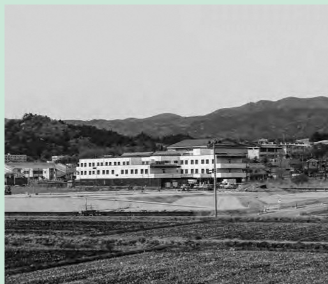
駅東側開発地区住宅団地

移住定住施策として、駅東側開発地区住宅団地の町外からの購入者(子育て世代や若年夫婦世帯)に対し、住宅用地取得支援金として1世帯あたり300万円を交付します。