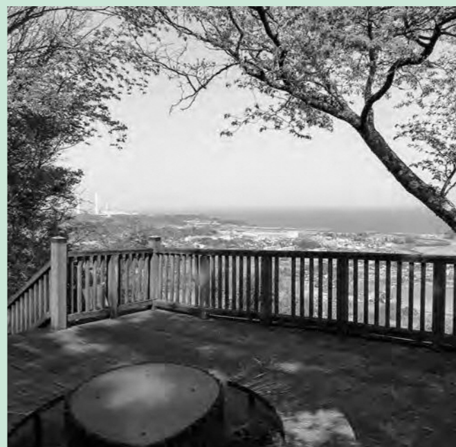
太平洋が一望できる高倉山展望台