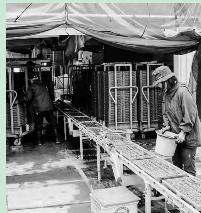
育苗作業を行う新規就農者(フロンティアひろの)

農業の持続的、安定的な発展を図るため、農業者の確保、育成及び定着を目的として、新規就農者等に対し補助金を交付します。