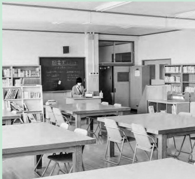
学校司書が配置された広野中学校図書室

学校図書館の充実と読書活動の推進を図るため、広野小学校及び広野中学校図書館の図書を整備し、学校図書標準蔵書数以上を維持、確保します。 学校司書の配置並びに図書管理システムの導入により、児童生徒の書籍への関心、読書への意欲を高め、読書活動の推進に取り組みます。