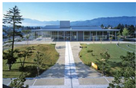
米沢上杉博物館 外観

行程表 *バスガイド付き* ※当日の道路状況や天候により内容、スケジュールが変更になる場合がございます。ご了承ください。