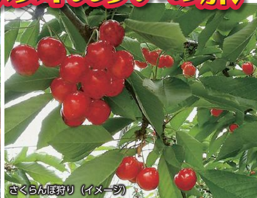
さくらんぼ狩り (イメージ)