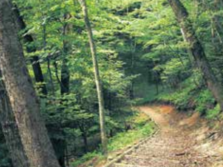
五社山ふるさとの森

【場所】広野町大字下北迫字ニッ沼103-16 【電話】0240-27-1130 【シーズン】3月下旬から4月中旬まで