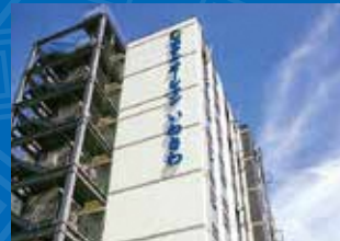
ホテルオーシャン いわさわ

場所／広野町大字下北迫字岩沢31-85 電話／0240-23-5460 FAX／0240-23-5461