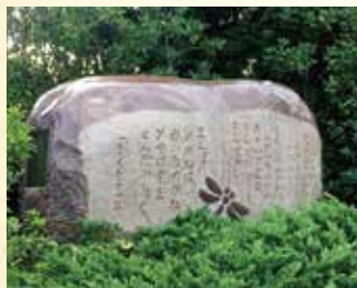
童謡「とんぼのめがね」歌碑