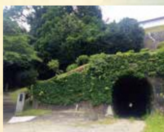
唱歌「汽車」トンネル