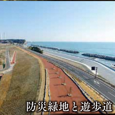
防災緑地と遊歩道

【場所】広野町大字下北迫字苗代替35 【電話】0240-27-4163 【シーズン】11月下旬から12月中旬まで