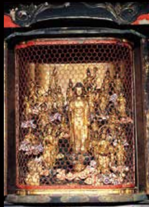
■町指定文化財 二十五菩薩像 彫刻・所有者／林蔵寺