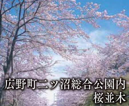
広野町ニッ沼総合公園内 桜並木

【場所】広野町大字下北迫字ニッ沼103-16 【電話】0240-27-1130 【シーズン】3月下旬から4月中旬まで