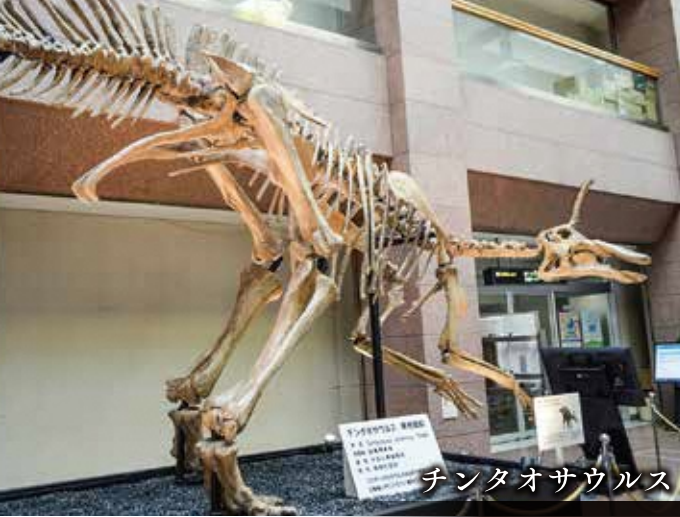
チンタオサウルス