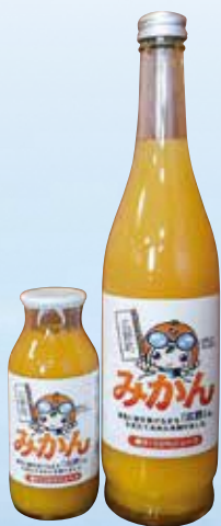
みかん 果汁100%ジュース