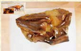
文化財等展示資料室

天気の良い日は、屋上テラスはいかがですか。ティータイムに、休日のピクニックにご利用ください。