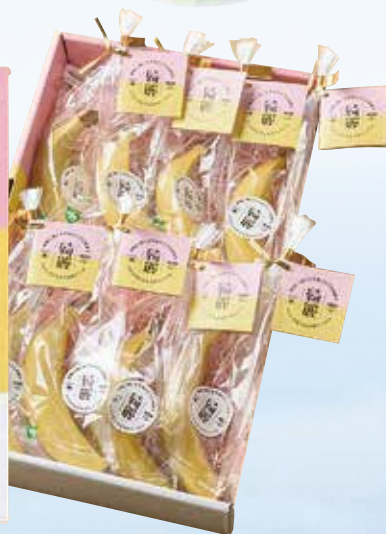
朝陽に輝く水平線がとても綺麗な みかんの丘のある町のバナナ 『綺麗』