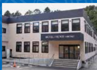
ホテルフロンテ広野

場所／広野町大字下北迫字ニツ沼45-32 電話／0240-23-6810 FAX／0240-27-3940