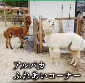
アルパカ ふれあいコーナー