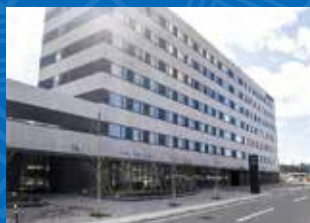
ハタゴイン福島広野

場所／広野町大字折木字南沢134 電話／0240-27-3161 FAX／0240-27-3162