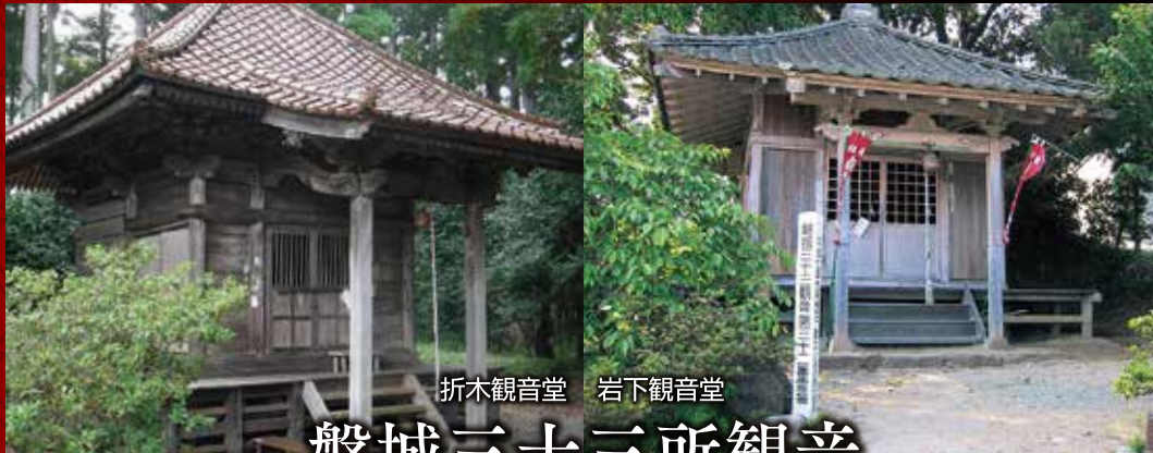
折木観音堂 岩下観音堂 磐城三十三所観音