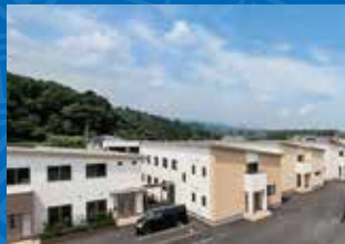
稲村屋 火の口本館