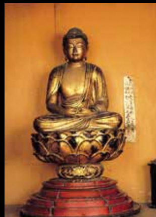
■具指定文化財 木造阿弥陀如来座像 彫刻・所有者／成徳寺