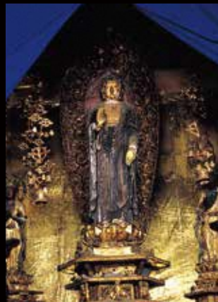
■町指定文化財 阿弥陀如来像 彫刻・所有者／林蔵寺