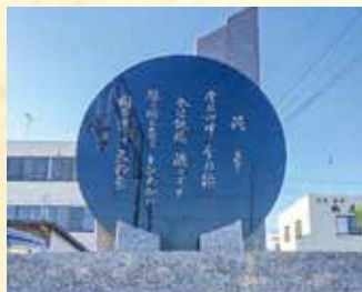
唱歌「汽車」歌碑 (JR広野駅)