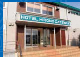
ホテル・広野ゲートウェイ

場所／広野町大字下浅見川字広長44-5 電話／0240-28-0011 FAX／0240-27-1481