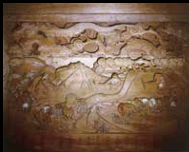
■町指定文化財 太田農神社本殿彫刻 彫刻・所有者／太田農神社氏子