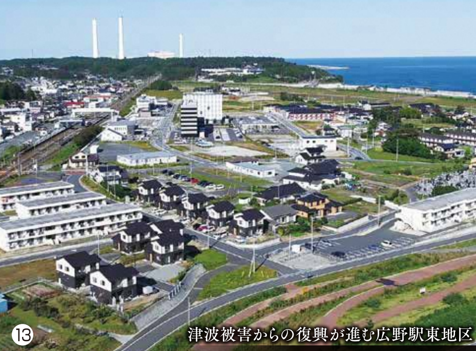
津波被害からの復興が進む広野駅東地区