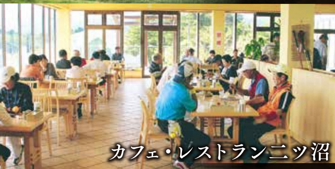
カフェ・レストランニツ沼