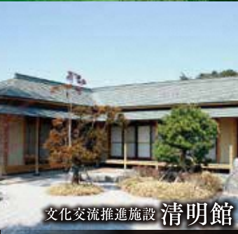
文化交流推進施設 清明館