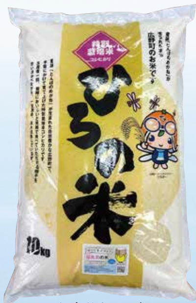
福島県広野町産 特別栽培 コシヒカリ