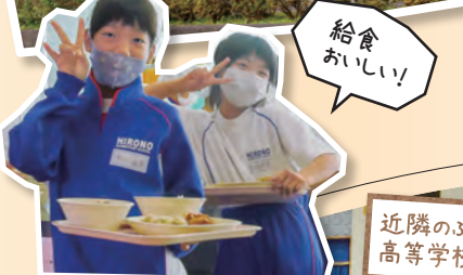
近隣のふたば未来学園高等学校との交流授業