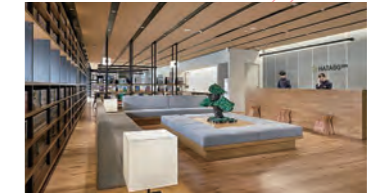
フロント・ロビー

「街とともに、お客様の人生をより楽しく、より豊かに。」を合言葉に、福島をより元気にしていきたいという情熱をもってお客様をお迎えしています。