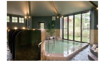
ホテル双葉邸「浜菊の湯」