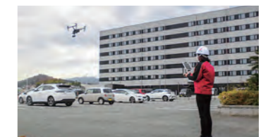
ドローン操作訓練