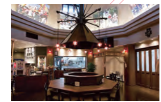
レストラン「ひまわり」

地域密着型のビジネスホテルの運営をしています。 東日本大震災後の地域を取り巻く経営環境の大きな変化を見据え、地域の発展や従業員の生活環境の向上を目指し、より付加価値の高い企業として、お客様や社会に貢献できるよう努力しています。 また、目標を強く明確に持つことにより、従業員が明るく、楽しむことを大事にしています。