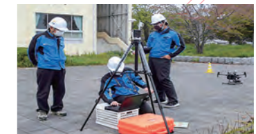
ドローン飛行準備

夢と情熱を持ち、次世代に輝く郷土を造ることを提案・実現化することを目指す強い意志を持った技術者の集まりです。 私たちは、測量・設計・調査・情報処理業務において各業務の意義と役割に自信と誇りを持ち、最近では、最先端のドローンを駆使した「Construction」にも積極的に取り組んでいます。これからも、より人と自然環境との調和がとれた空間の創造に貢献してまいります。