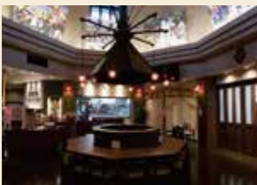
レストラン「ひまわり」