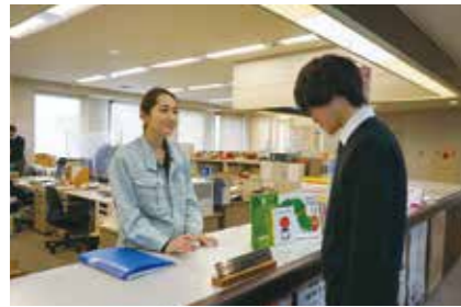
広野町子育て世代包括支援センター