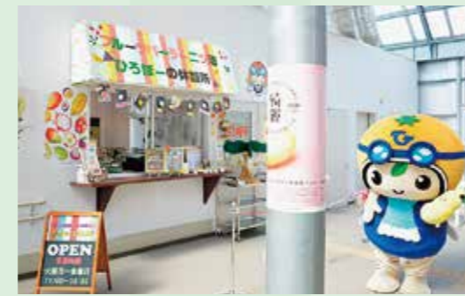
ひろぼーの休憩所

国産バナナをはじめ南国フルーツの栽培に取り組む観光農園。 新たな広野町の味をご堪能あれ。