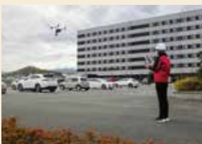
ドローン操作訓練

夢と情熱を持ち、次世代に輝く郷土を造ることを提案・実現化することを目指す強い意志を持った技術者の集まりです。 私たちは、測量・設計・調査・情報処理業務において各業務の意義と役割に自信と誇りを持ち、最近では、最先端のドローンを駆使した i-Construction にも積極的に取り組んで、より人と自然環境との調和がとれた空間の創造に貢献してまいります。