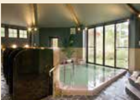
ホテル双葉邸「浜菊の湯」

地域密着型のビジネスホテルの運営をいたしております。 東日本大震災後の地域を取り巻く経営環境の大きな変化を見据え、地域の発展や従業員の生活環境の向上を目指し、より付加価値の高い企業として、お客様や社会に役立つ企業を目指しております。 また、目標を強く明確に持つことにより、従業員が明るく、楽しむことを大事にしております。