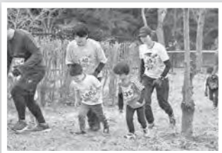
ライバルを励ましながら走る小さなヒーロー

未就学児と保護者がペアで参加したり、小学校低学年の部・中学年の部・高学年の部に別れて走ったり、各部門とも結構な参加者がいました。中にはスポーツクラブやランニングクラブのユニフォーム・鉢巻き姿で疾走する気合いの入った子供達も多く、かっこ良かったです。