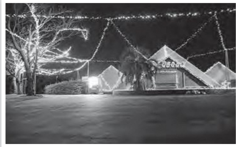
南門を入るとこんな感じ

南門と南駐車場を開放しておりますので、ご家族で或いはカップルで楽しんでください。お一人様での撮影も大歓迎です。