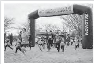
気合い入ってます!!

1月9日（月・祝）「Mt.mafu project」（マウントマフプロジェクト）さん主催の「ふくしまキッズトレイルラン大会」と「2時間耐久ミニトレイル駅伝大会」が二ツ沼総合公園で開催されました。