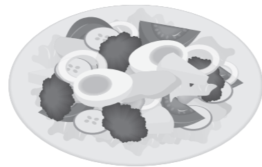
エネルギー 37kcal / 塩分 0.8g