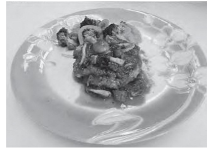
エネルギー 293kcal / 塩分 1.7g