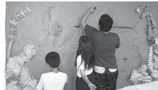
↑「海の巨大絵画」に挑戦した子どもたち

水曜日の「ひろの元気教室」は参加者がやりたいことを選べる日です。今回は夏休み前から準備していた「海の巨大絵画」に有志が挑戦しました。壁に貼った大きな青い模造紙に思い思いの海の生き物を描きました。図書室の図鑑やタブレットを参考にしたり、オリジナルの生物を描いたり、折紙で海藻を作ったりと、未来の芸術家たちによる個性豊かな海洋生物が壁を彩りました。