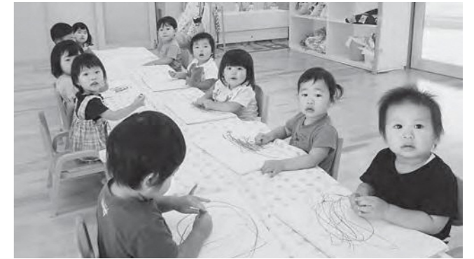
↑お絵描きを楽しむたんぽぽ組のこどもたち

お絵描きを楽しむたんぽぽ組のおともだち。赤や青、黄色などいろいろな色で思いおもいに絵を描いています。大きな丸や線を描いてニコニコ笑顔の子どもたちです！次は何色で描こうかな？