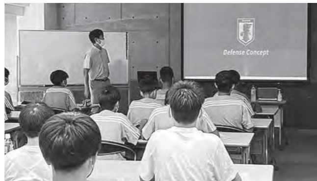
↑森保監督よりレクチャーを受けるアカデミー生