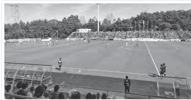
9/25 Jヴィレッジスタジアムで行われたFC岐阜戦