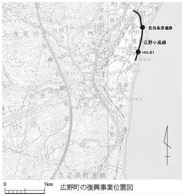
広島市の復興事業位置図