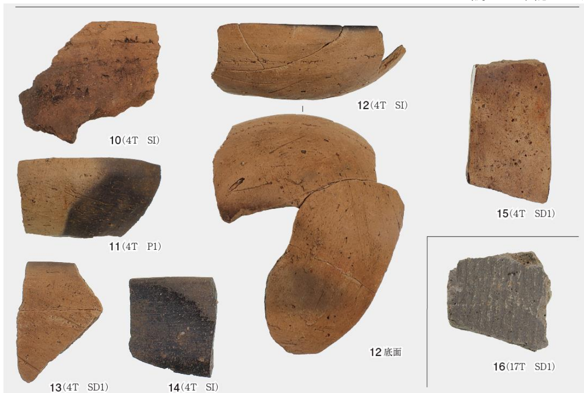
試掘・確認調査出土遺物⑤