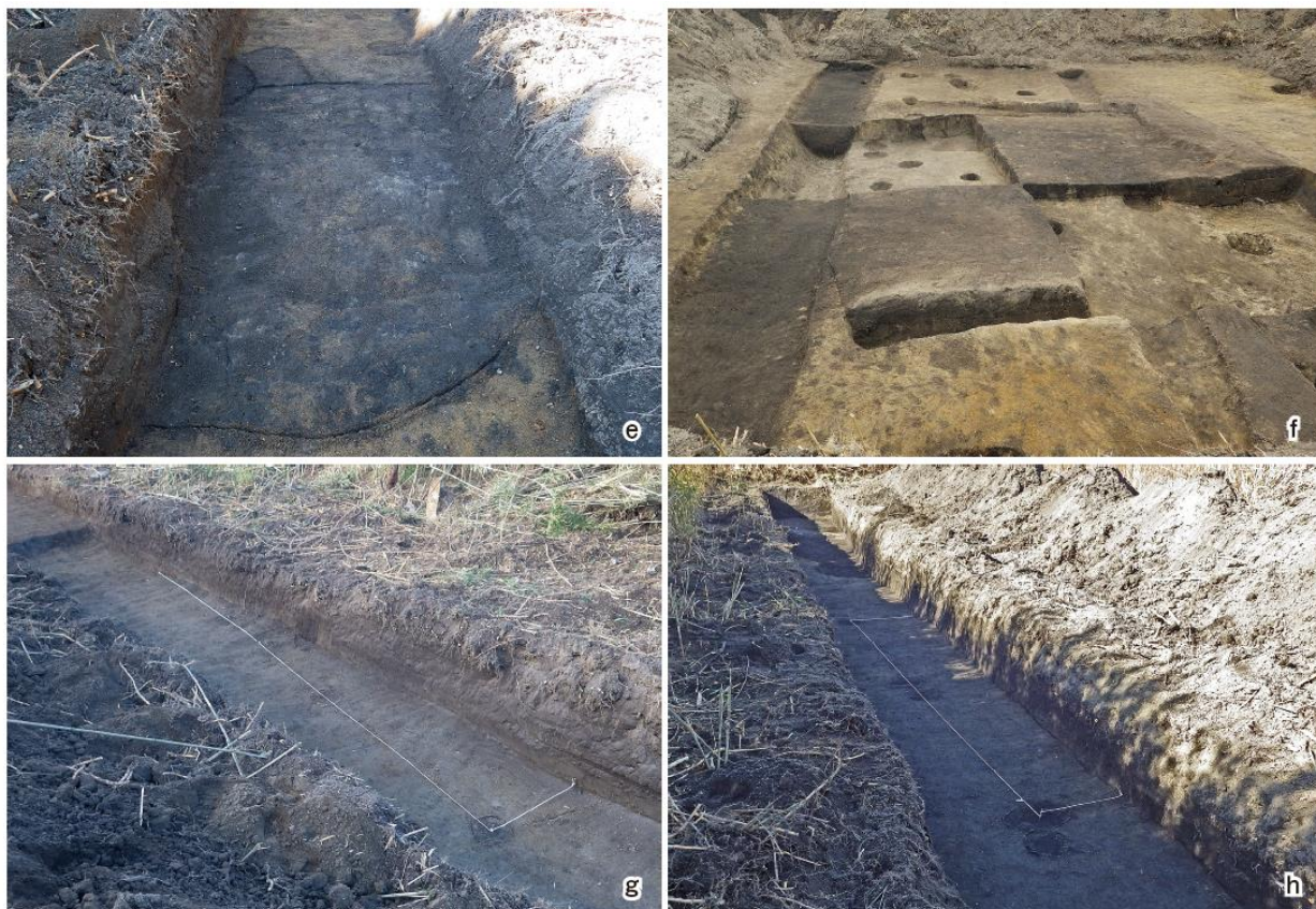
県道広野小高線 HN-B1 (本町遺跡)