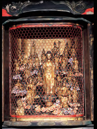
町指定文化財 二十五菩薩像 彫刻・所有者／林蔵寺