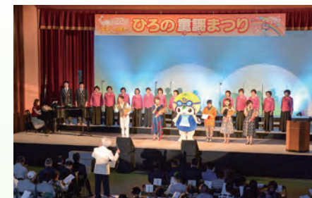
ひろの童謡まつり

【事務局】広野町役場復興企画課 【場所】広野町二ツ沼総合公園 【電話】0240-27-1251 ※詳しくは、広野町HPで発表いたします。