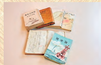
作品展示室・童謡展示室

化石などの埋蔵文化財を展示します。町内発掘品や収蔵品をご覧ください。体験型ワークショップも開催します。