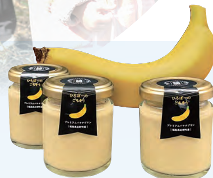
プレミアムバナナプリン ひろぼーのごちそう