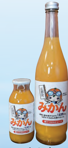
みかん 果汁100%ジュース