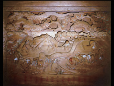
町指定文化財 太田農神社本殿彫刻 彫刻・所有者／太田農神社氏子