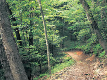
五社山ふるさとの森

【場所】広野町大字下北迫字ニッ沼103-16 【電話】0240-27-1130 【シーズン】3月下旬から4月中旬まで