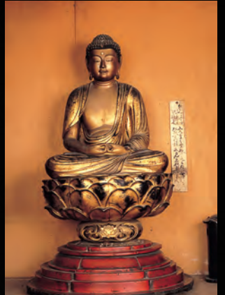
県指定文化財 木造阿弥陀如来座像 彫刻・所有者／成徳寺