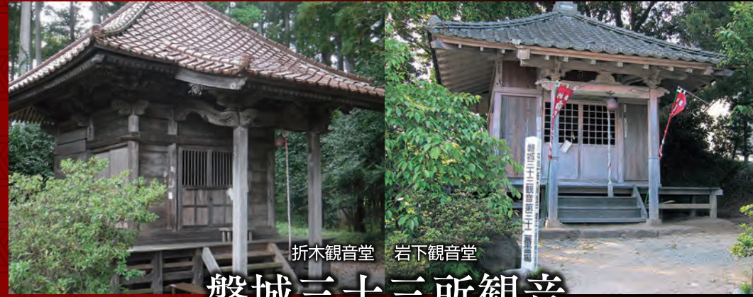
折木観音堂 岩下観音堂 磐城三十三所観音