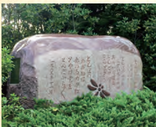
童謡「とんぼのめがね」歌碑