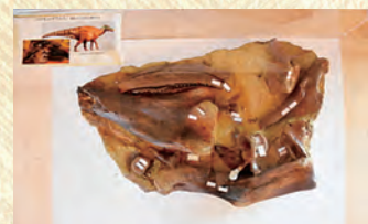
文化財等展示資料室

化石などの埋蔵文化財を展示します。町内発掘品や収蔵品をご覧ください。体験型ワークショップも開催します。