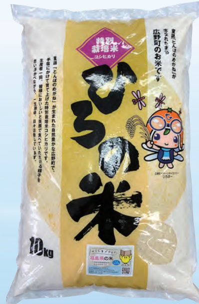
福島県広野町産 特別栽培 コシヒカリ