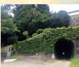
唱歌「汽車」トンネル

とんぼのめがね 作詞 額賀 誠志 作曲 平井康三郎 とんぼのめがねは 水いろめがね 青いおそらを とんだからとんだから とんぼのめがねは びかびかめがね おてんとさまを みてたからみてたから とんぼのめがねは 赤いろめがね 夕焼け雲を とんだからとんだから