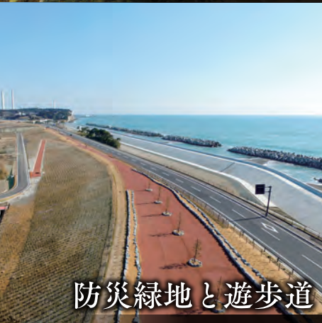
防災緑地と遊歩道

【場所】広野町大字下北迫字苗代替35 【電話】0240-27-4163 【シーズン】11月下旬から12月中旬まで