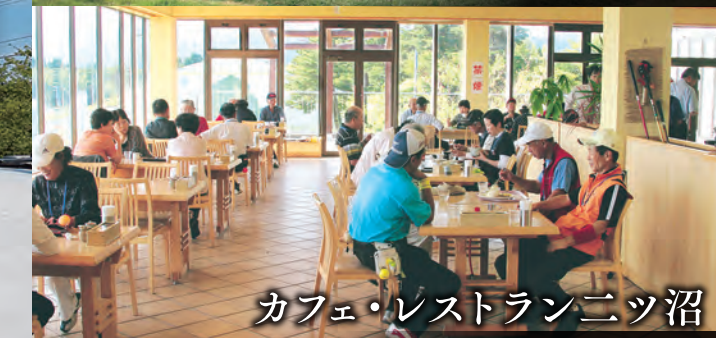
カフェ・レストランニッ沼