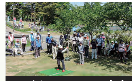
二ツ沼パークゴルフ大会

【事務局】ひろの童謡まつり実行委員会 【場所】広野町大字下北迫字苗代替35 【電話】0240-27-1251 【開催時期】毎年10月中で調整中 ※詳しくは、広野町HPで発表いたします。