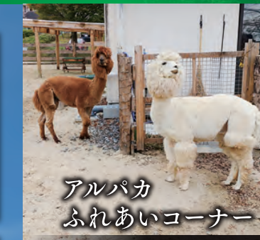
アルパカ ふれあいコーナー