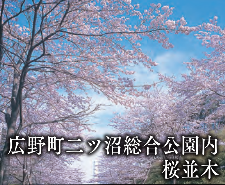
広野町ニッ沼総合公園内 桜並木

【場所】広野町大字下北迫字ニッ沼103-16 【電話】0240-27-1130 【シーズン】3月下旬から4月中旬まで