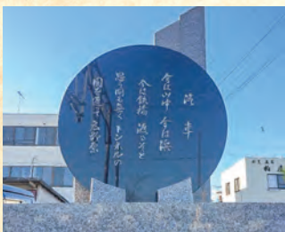
唱歌「汽車」歌碑(JR広野駅)