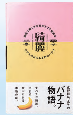
朝陽に輝く水平線がとても綺麗な みかんの丘のある町のバナナ 『綺麗』