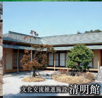
文化交流推進施設 清明館