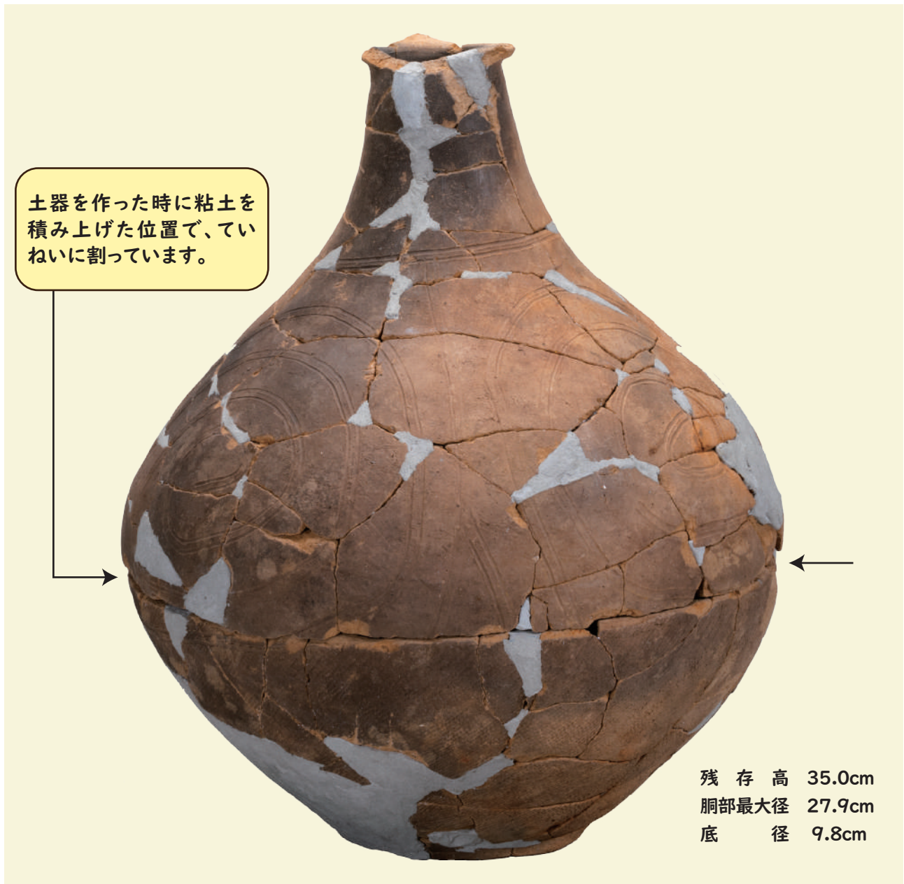
◎土器棺に使われていた弥生土器の壺（第1号埋設土器）