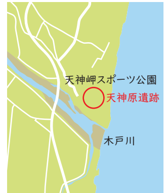
◎天神原遺跡の位置