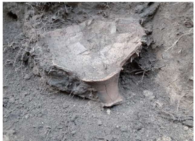
◎壺が逆さまに埋められていた様子