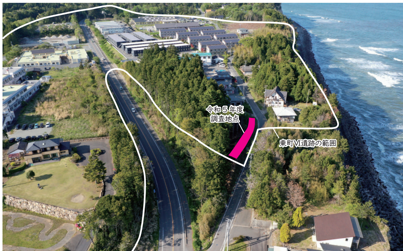
空から見た東町VI遺跡

発掘調査の成果は、『東町遺跡（第3次）』（広野町文化財調査報告第9冊）として報告されています。