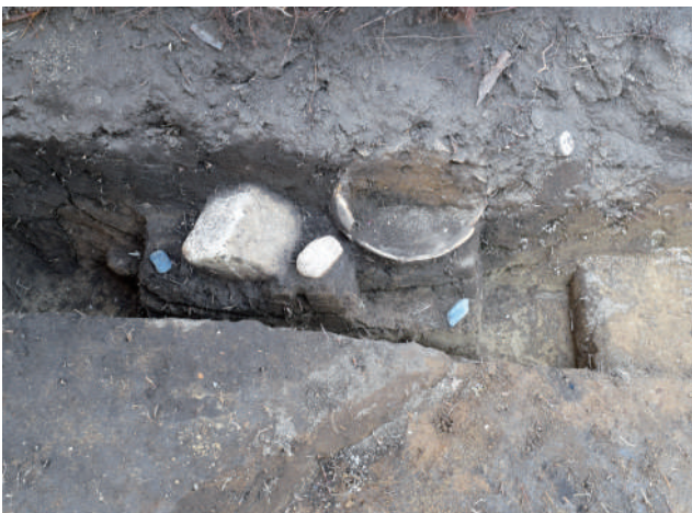
◎土器棺墓が見つかった様子