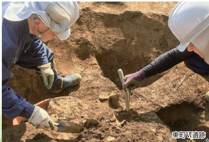
東町 VI 遺跡