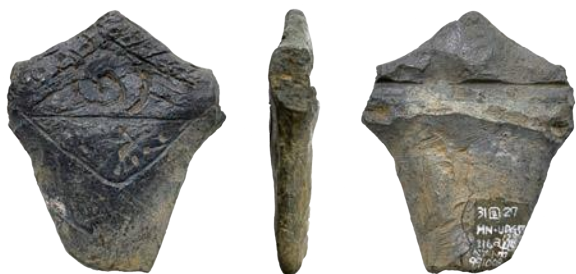
上田郷 VI 遺跡