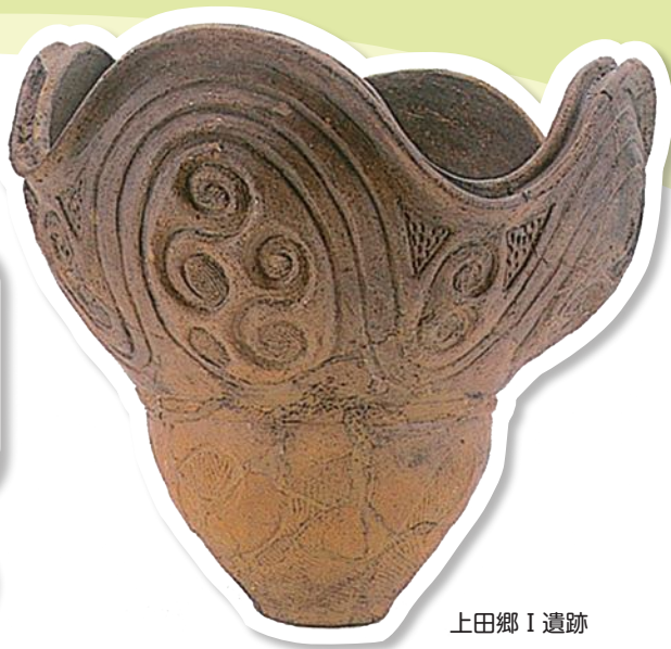
上田郷 I 遺跡