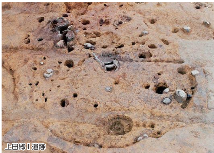
上田郷 I 遺跡