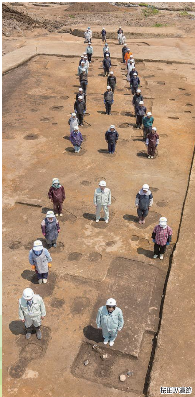
桜田 IV 遺跡