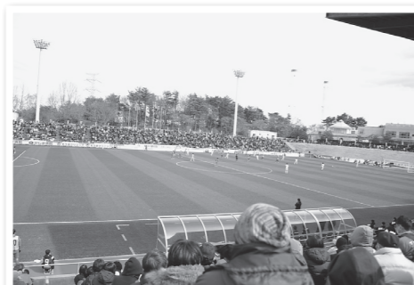
多くの観客が詰め掛けたスタジアム

ホーム開幕戦に合わせ、8市町村のホームタウン協定締結セレモニーが行われたほか、「フタバズキリュウ」の化石にちなんだいわきFCの公式マスコットが紹介され、会場を盛り上げました。