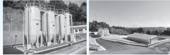
連続移動床前処理装置