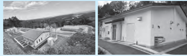
小滝平浄水場全景