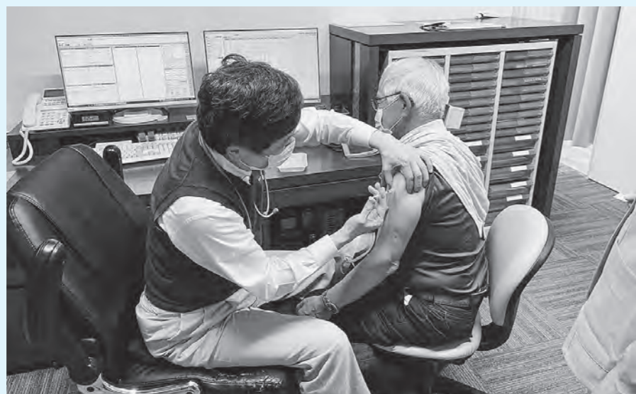
▲馬場医院でのワクチン接種の様子