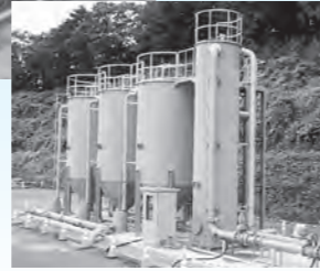
連続移動床前処理装置