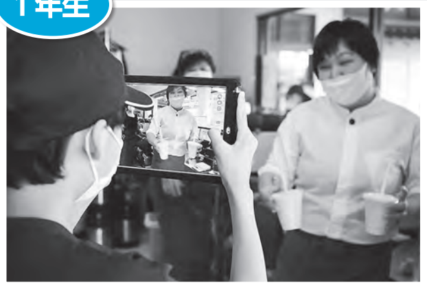
『観光パンフレット作成』のためインタビュー