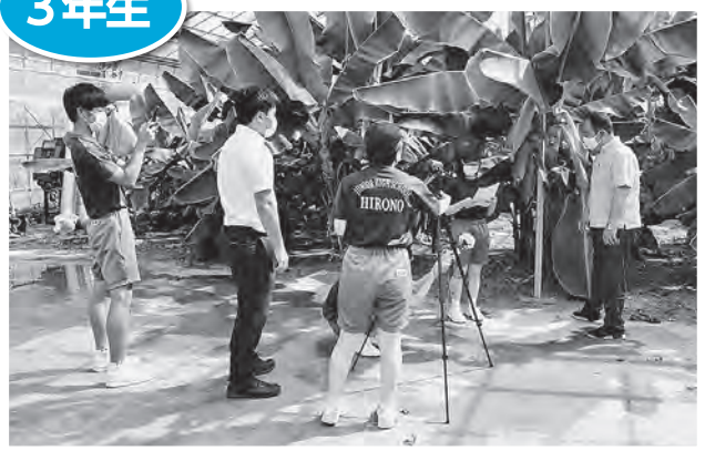
『広野町の魅力』をインタビュー