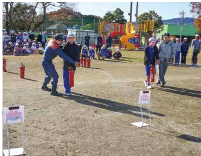
↑消防署職員から水消火器の使い方を学ぶ児童ら

12月3日、校舎内から火災が発生したという想定の下、避難訓練を実施しました。避難開始の合図から3分ほどで全員避難することができました。消防署の方から「お・か・し・も」についてお話をいただきました。その後、5・6年生が水消火器を使って消火訓練をしました。また、教員が屋内消火栓からの放水訓練も行いました。これから乾燥し風が強くなり、火災の起きやすい季節になります。火の元には十分注意するように確認しました。