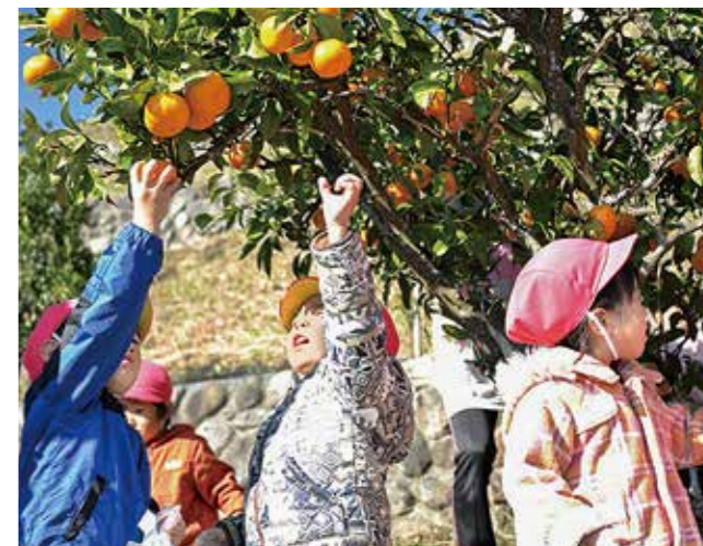
↑3歳から5歳児約60人が参加したみかん狩り

広野町役場の西側にある「みかんの丘」で、みかん狩りを行いました。3歳から5歳児約60人が参加し、たわわに実ったみかんを一生懸命収穫し、試食すると「甘い」「おいしい」「もっと食べたい」と青空の下で歓声が響きました。