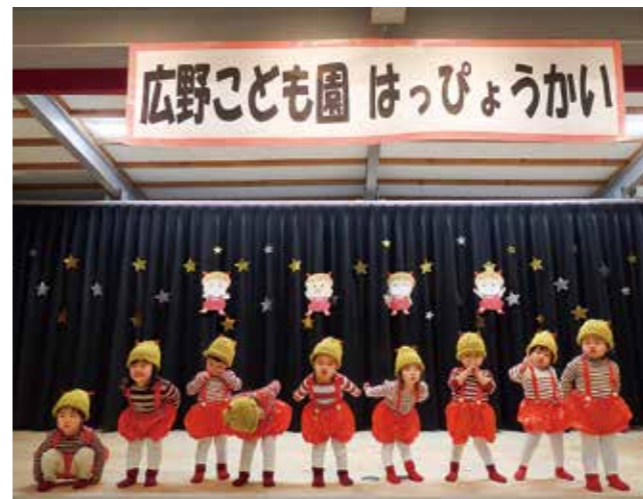
↑ニコニコお顔のポーズがかわいい1歳児たんぽぽ組です