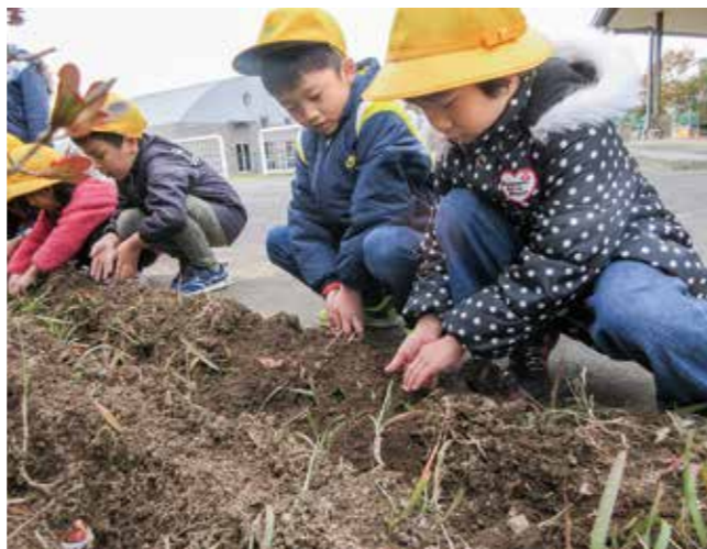
↑きれいな花が咲きますように…

1年生のお友だちがチューリップの球根を植えました。『お布団をかけてあげよう♪』『大きくなってね!!』と優しい言葉をかけながらそっと土をかける子どもたち。赤や黄色、白にピンク…子どもたちと一緒に、色とりどりのきれいなチューリップが咲くことを楽しみにしていきたいと思います。