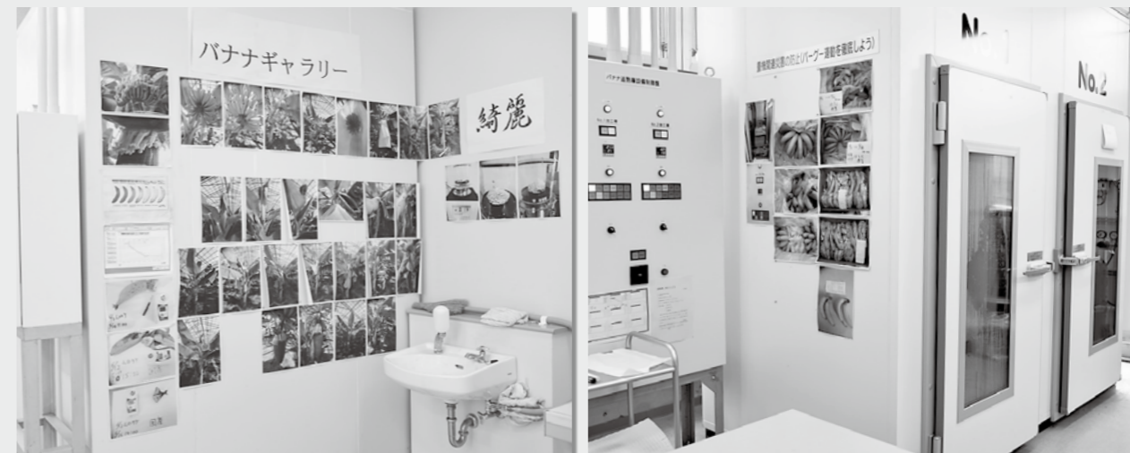
「綺麗」の結実から出荷までの様子などがわかるギャラリー(左)と追熟庫(右)