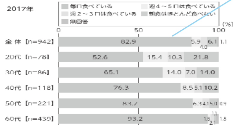
第2次はつつ広野元気プラン より

2017年に町民を対象に実施したアンケートでは、「朝食を毎日食べている」割合は全体では82.9%でした。20代で最も低く、年代が上がるにつれて高くなっています。