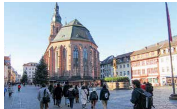
↑ミュンヘンの町並み