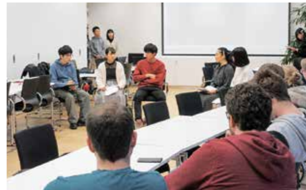
↑ミュンヘン工大での発表の様子