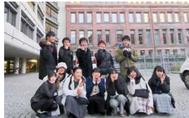
↑フライブルグ大学での様子

学校に戻って以降も、これからの自分自身の進路、参加できなかった級友たちへの学びの還元に進進していってくれることを期待しています。