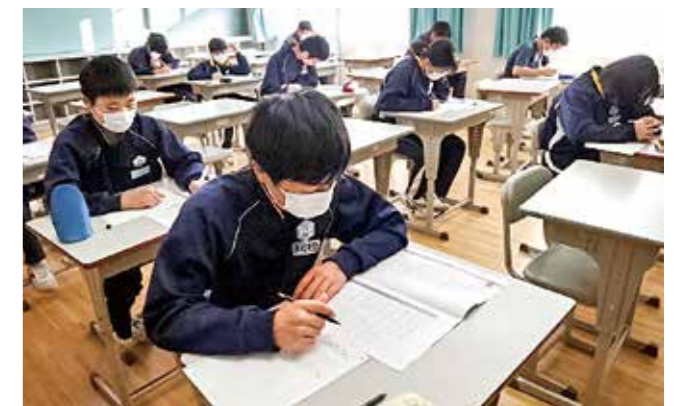
↑真剣な表情で英語検定に取り組む生徒たち

1月24日(金)、今年度の英語学習の成果を確認する「第3回英語検定」を実施しました。