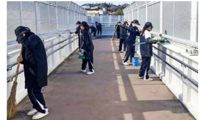
↑JR広野駅周辺を清掃する生徒たち

1月17日(金)、1学年の生徒たちは、築地ヶ丘公園とJR広野駅周辺の清掃ボランティアを行いました。