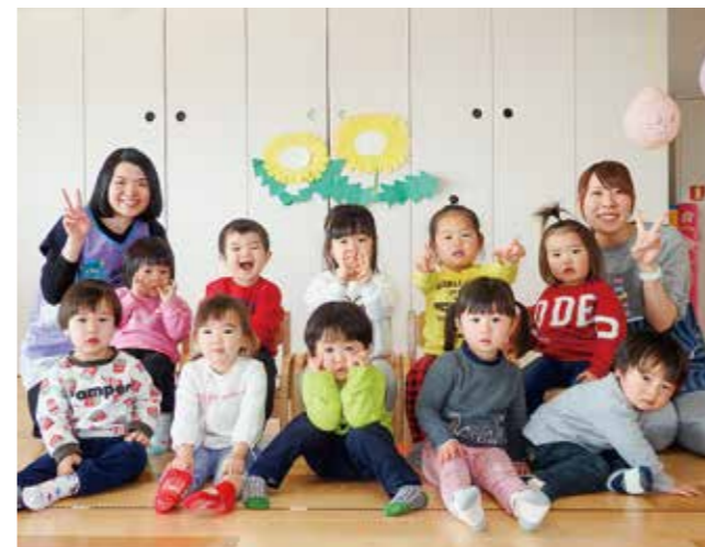
↑1歳児たんぼ組「全員集合!!」です。

1歳児たんぼ組。4月初めは6名でのスタートでしたが、お友だちが増え10名になりました。何でも興味をもち、やってみようとする1歳児。お友だちとおしゃべりや、お給食も一人で食べられるようになりました。この一年間で心身共に大きく成長した子どもたち。たくさんの経験から次のステップへとつなげてほしいと思います。