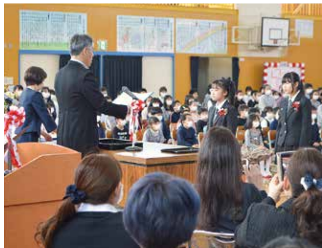
↑卒業証書授与を待つ卒業生

3月23日（月）6年生32名の卒業証書授与式が行われました。3月4日からの学校臨時休業のため、式の練習はできませんでしたが、厳粛な雰囲気の中、無事終了することができました。卒業式は規模を縮小し執り行われましたが、来賓の方々からは多くの温かい励ましの言葉をいただきました。卒業生は、小学校生活の思い出を振り返り中学校生活に向けて、気持ちを新たにしていました。