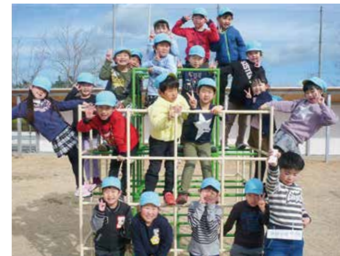
↑青空のもと、満面の笑みの5歳児さくら組です。

広野こども園が開園し、一年が経ちました。新しい園舎で元気いっぱい過ごし、楽しい思い出がたくさんできました。さくら組20名、笑顔で卒園。4月からは一年生です!!こどもたちの育ちゆく力が、小学校に入りますますます伸びていくことを願い、これからの活躍を楽しみに見守っていきたいと思います。