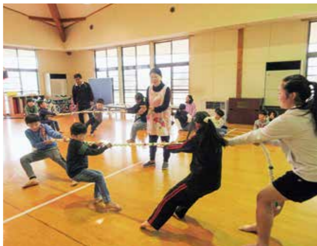
↑力いっぱい引っ張りました!

2月生まれの子どもの誕生会を行いました。歌をうたったり、インタビュー・コーナーがあったり、美味しいケーキを食べたり…みんなでお祝い♪その中でも盛り上がったのは、学年混合で行われた『つなひき大会』です!!男の子も女の子も裸足になり、真剣勝負!!力を合わせて一生懸命頑張った子どもたちはとても満足そう…楽しい1日になりました☆