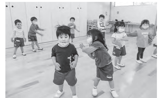
↑楽しそうに体操をする園児ら

先月から、毎日全園児でラジオ体操を行っています。はじめての子どもたちも多いようでしたが、日々繰り返しの中少しずつ覚えてきて、一生懸命体を動かしています。