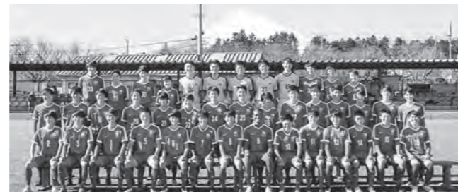
↑JFAアカデミー福島10期生ら