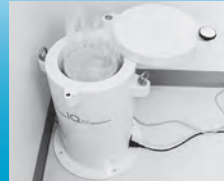
学校給食に使用する食材については、毎日放射物質の検査をしています。