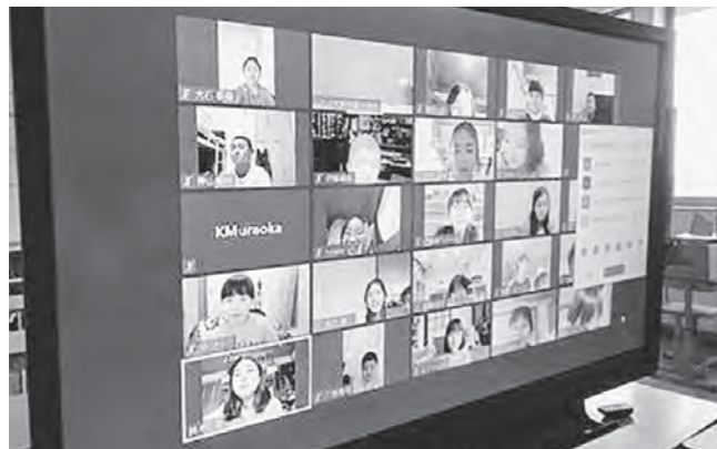
↑オンライン授業に参加した小学生ら

5月20日(水)ふたば未来学園中学校では、小学生を対象にした第3回オンライン授業体験を実施しました。今回は数学科の2回目として、「やってみよう!数学!」を実施しました。