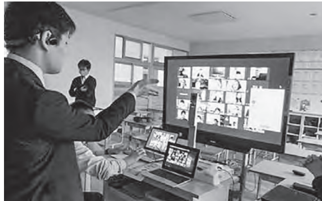
↑小学生らに数学を教える中学生