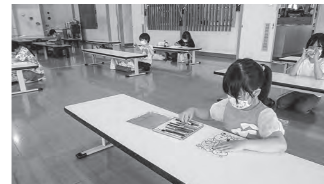
↑自由に遊ぶ子どもたち

5月中旬の児童館での様子です。学習や読書、ぬりえやお絵かき、折り紙やあやとりなど…自分で決めた遊びを自由に行う個人活動の時間です。折り紙では、鳥や可愛いカップケーキを作ったり、本を見ながら難しいあやとり挑戦したり、一人ひとりが自分で考え頑張る姿が見られました。楽しい時間になるよう工夫しながら、今の時期を乗り越えていきたいと思っております。