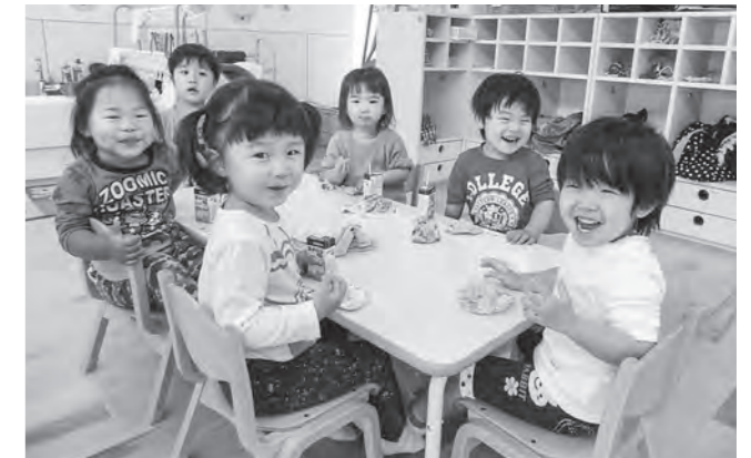
↑美味すぎてニコリ

毎日、楽しみにしているおやつタイム☆ お友だちとおしゃべりしながらもぐもぐ…。 あまりの美味しさに、思わず笑顔になった2歳児ばら組さん。 ペロリと食べてあっという間に完食「ごちそうさまでした☆」