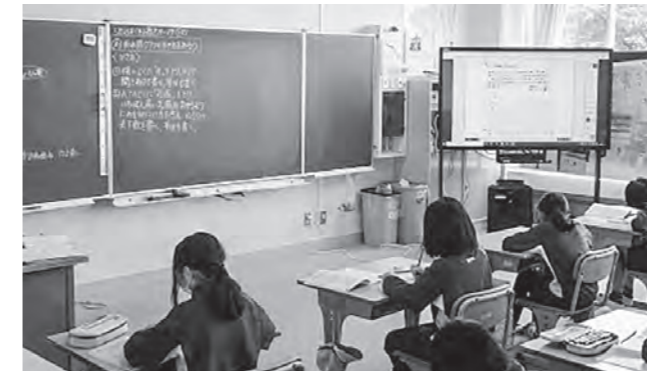
↑グラフの書き方を学習する3年生

5月とは思えない寒い一日でした。そのような中、PTAの方々によるあいさつ運動がありました。それぞれが通学路に立ち、子どもたちの登校を見守ってくださいました。ありがとうございました。教室をのぞいてみると3年生は電子黒板を使ってグラフの書き方を学習していました。25日からは、毎日登校となります。新型コロナウイルス感染症予防に努めてまいりますので、引き続きご協力をお願いします。