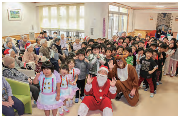
←笑顔いっぱいの子のクリスマス会でした♪

12月7日、花ぶさ苑のクリスマス会に参加してきました！各クラス、発表会のお遊戯を笑顔で披露しました♪最後に大きな声で「サンタさん!!」と呼ぶと…トナカイとサンタクロースが登場！子どもたちはお菓子のプレゼントに大喜びでした☆