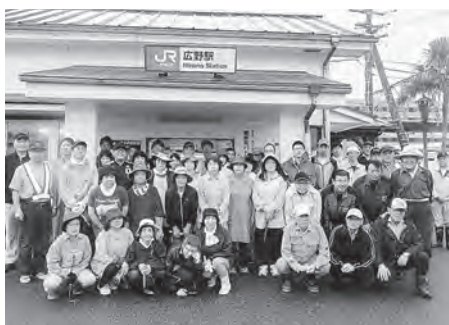
駅前広場などの清掃・除草などを実施

9月15日、雨が降る中、JR広野駅および周辺にて、広野駅環境美化推進協議会をはじめ、広野町婦人会、地元企業、JR東日本、町職員など多数の方の参加をいただき、駅構内や駅前広場の清掃・除草作業を実施しました。