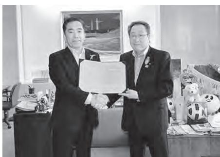
富岡町と協定を締結

防災拠点道の駅は、9月21日に富岡町と「発生土の引き渡しに関する協定」を締結しました。この協定は道の駅敷地から発生する土砂を富岡町に有効かつ合理的に利用してもらうための協定であり、両町が実施する事業において事業費負担を軽減するためのものです。また、本町は、道の駅敷地内の伐採工事および工事用道路設置工事を発注し、国土交通省磐城国道事務所は、工事用道路に進入するための仮設右折レーンを国道に設置する工事に着手しました。