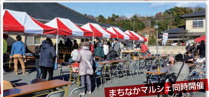
まちなかマルシェ同時開催

あなたの写真が広報ひろのに載っていたら、総務課の窓口でお渡しできます。お気軽にお問い合わせください。