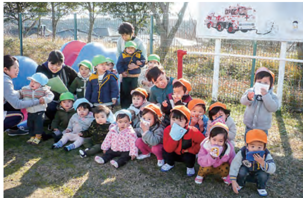
←みんな落ち着いて避難できました

保育所では毎月1回避難訓練を行っています。12月は地震から火災発生になった時の避難訓練をしました。子どもたちは泣かずに、ハンカチを口と鼻に当てて上手に避難することができました。乾燥する冬、火災には気を付けていきましょう。