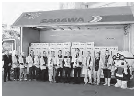
ふるさと応援寄付金に対する発送式

税者に対する返礼品として、特別栽培米（コシヒカリ）の第一便出発式を執り行いました。これまで、全国45都道府県から1600件以上の申し込みを受け付けており、来年2月まで、納税者の皆様に向けて広野産の特別栽培米を発送します。