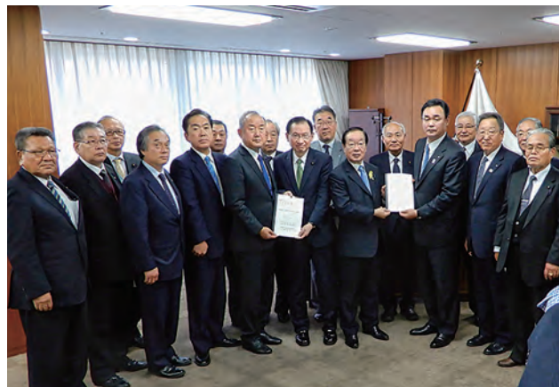
↑渡辺博道復興大臣（写真右から7人目）に要望書を提出

12月20日、21日、双葉地方町村会と双葉地方町村議会議長会は合同で、復興庁の渡辺博道復興大臣をはじめ、各省庁に対し要望活動を行いました。要望事項として、①避難地域の復興の実現、②復興推進体制の継続、③帰還困難区域の取扱い、④復興に向けた人員の確保、⑤中間貯蔵施設および最終処分場の確保・整備・安全管理、⑥イノベーション・コースト構想の着実な実現、⑦避難者に係る国民健康保険・介護保険等の支援制度の継続、⑧双葉地方の復興に向けた道路・鉄道の復旧・整備、などで、双葉地方の復興が成し遂げられるまで国の責務として対応するよう強く訴えました。