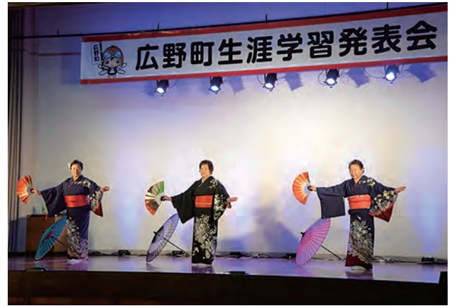
↑町内各種団体が踊りや歌を披露

12月2日、広野町中央体育館を会場に、第22回広野町生涯学習発表会を開催しました。今年は、11団体が参加し、日ごろの練習の成果を存分に発揮していました。会場では、各種団体が趣向を凝らした踊りや音楽を披露し、時には観客と一緒に体操や歌を歌うなど出演者と観客が一体となり大いに盛り上がりました。