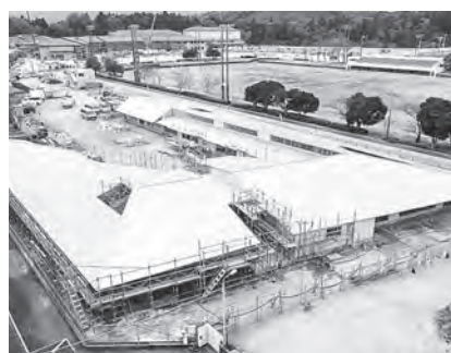
開園に向け進む工事

認定こども園の整備については、現在、本体の屋根・外壁工事が終了し、内装工事を行っており、外構工事にも着手しました。