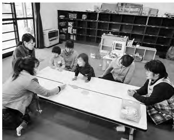
11/22 児童館で遊びました！