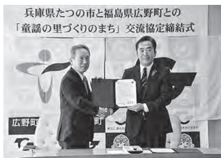
たつの市と協定を締結

10月5日、兵庫県たつの市山本実市長と「童謡の里づくりのまち」交流協定を締結しました。童謡誕生100年という節目の年を迎え、童謡の普及と世代を超えて歌い継がれることを目指し、取り組みます。