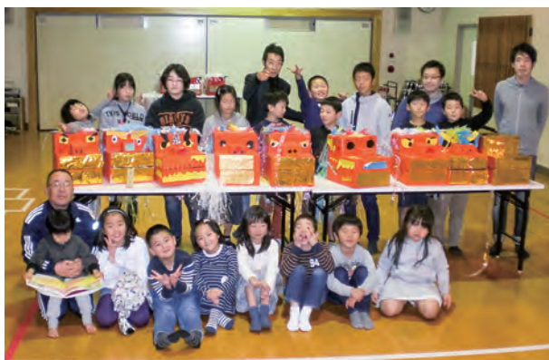
←個性豊かな獅子舞ができました☆

12月18日、子どもたちが新年に向けて獅子舞作りにチャレンジしました。お手伝いのお兄さんたちに教えてもらいながら、絵の具を塗ったり、折り紙で目や歯などを作ったり、様々な顔の力強い獅子舞に仕上げていきました。 『今年一年、健康で元気でいられますように♪♪』