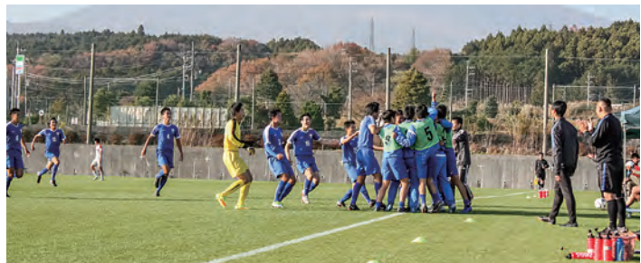
←課題を克服して結果を残した選手たち