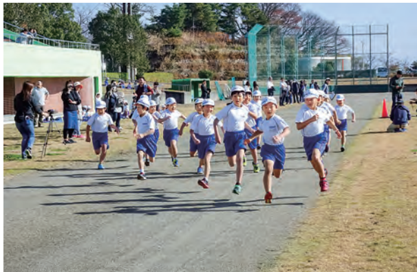
←あきらめずに最後まで頑張りました

12月4日、持久走記録会を総合グラウンドで行いました。季節はこれらの暖かさの中、子どもたちは元気に日頃の練習の成果を発揮しました。誰一人、途中で投げ出すことなく最後まで走り抜くことができました。力一杯走った姿は、とてもすばらしかったです。多くの保護者の皆さま、地域の皆さまに応援していただきありがとうございました。