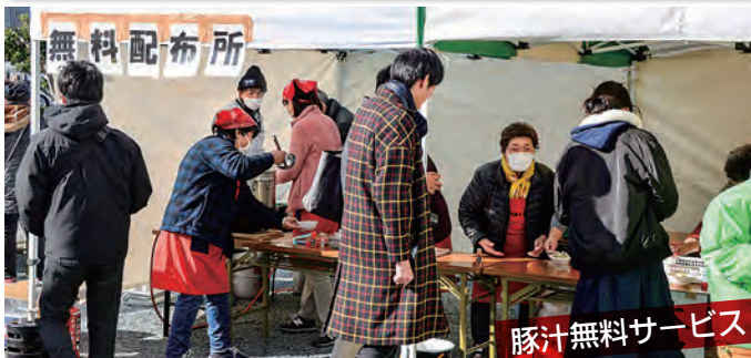
豚汁無料サービス