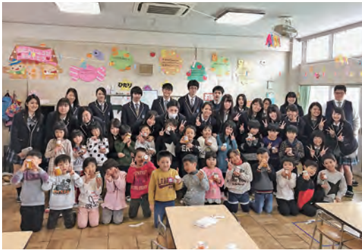
↑みかんジャムのラベルを作りました