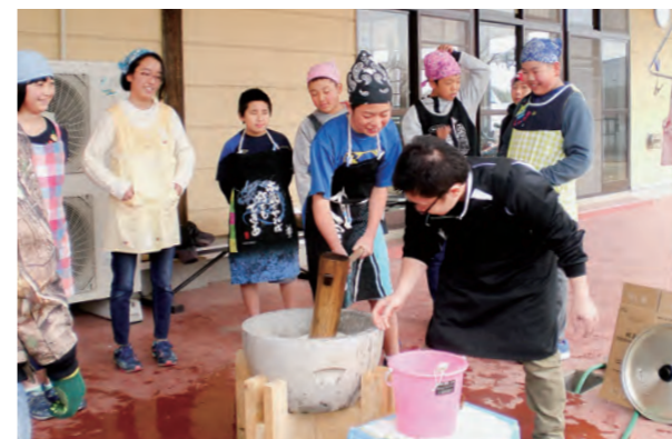
←餅つきを体験した子どもたち

12月28日、ボランティア・保護者のみなさんにご協力いただき、もちつき会が行われました。子どもたちは昔ながらの臼と杵で『ヨイショ!ヨイショ!!』と声を掛け合いながらもちつき、身体全体で日本の伝統文化を体験することができました。出来上がったもち丸を飾り餅にしたり、「きなこ餅」や「お雑煮」にしたりしてお腹いっぱい味わいました♪