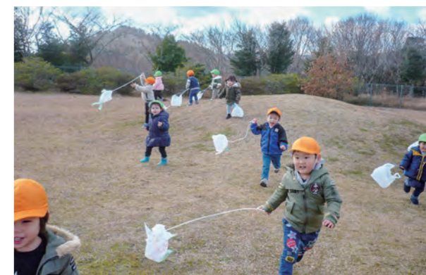
←たこたこあがれを楽しむ子どもたち☆

天気の良い日にたこあがれをしました。「たこたこあ〜がれ♪」と元気に歌う子どもたちは、自分で作ったたこを嬉しそうに持って、猪突猛進!!走って走ってたこあがれを楽しみました♪広野町保育所での外遊びものこりわずか…戸外で思いきり身体を動かして楽しみたいです。