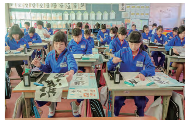
←一字一字真剣に取り組む子どもたち

1月11日、校内で書き始め会を行いました。少し緊張しながらも姿勢良く、一字一字丁寧に取り組む姿が見られました。1、2年生は硬筆を、3年生以上は毛筆を行いました。全員の作品を校内に展示し優秀作品には賞状を授与する予定です。