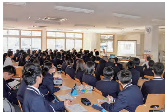
↑薬物乱用防止教室の様子