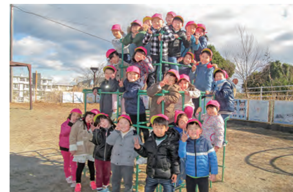
←寒さなんてへっちゃら♪

毎日寒い日が続きますが、子どもたちはとっても元気です!園庭で鬼ごっこやマラソン・なわとびと、身体を動かすことが大好きでお部屋に入ると「暑い」と汗をかいていることも…みんなで寒さなんて吹き飛ばしてしまおうです☆年長さんのお友だちは残りわずかな幼稚園生活を元気に過ごしたいと思います♪