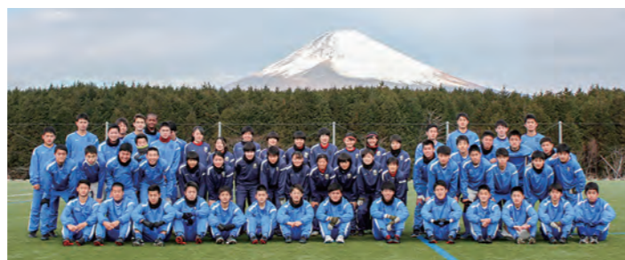
←目標に向かって練習に励んでいる選手たち