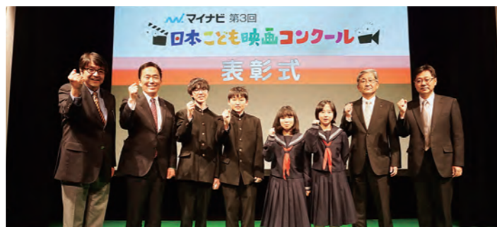
←表彰式に出席した生徒と関係者ら

第3回日本子ども映画コンクールにおいて、本校1年生の作品「愛しのAiAi」が入賞し、1月19日に東京で行われた表彰式に生徒4人が出席しました。「愛しのAiAi」は東日本大震災後に閉店した町内のショッピングセンターをテーマに、町民の思いなどをまとめたドキュメンタリー作品です。 なお、入賞作品は、3月17日19時より全国無料衛星放送「BS11」で放送されることになっています。