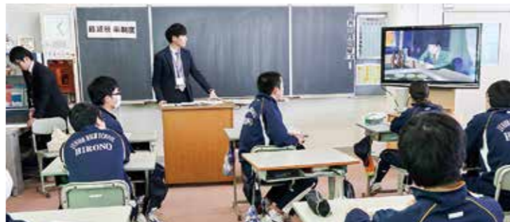
←租税について学ぶ生徒たち

2月12日、相双地方振興局租税部の方々を講師にお招きし、3年生を対象に租税教室を行いました。民主主義の根幹である租税の意義や役割を正しく理解し、社会の構成員として税金を納め、その使い道に関心を持ち、さらには納税者として社会や国の在り方を主体的に考えるよい機会となりました。