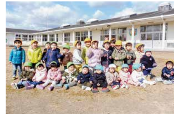
←お友だちといっぱい遊ぼうね☆

だいすきなお友だちと一緒に保育所の前で「はいっ、チーズ♪」。保育所での生活も残すところあとわずかとなりました…。たくさん遊んで楽しい思い出を作ろうね♪