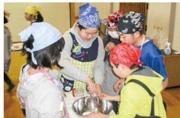
←自分だけのカップケーキ作り♪

2月13日、14日に「カップケーキ」を作りました。卵を割り、牛乳や砂糖を泡立て器でよく混ぜ、ホットケーキミックスを加えて生地を作ります♪♪生地をカップに入れ、レンジでチーン!「うわぁ〜すごい!膨らんできた!!」と嬉しそうな声。生クリームやいちごなどでデコレーションをして、自分だけのケーキが完成です。甘くて優しい味に、みんなニコニコ笑顔でした♪♪