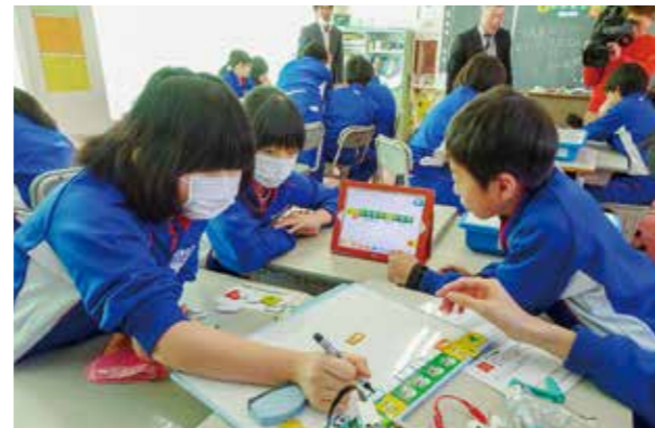
←創意工夫しながら取り組んだ生徒たち

本校は、今年度、県教育委員会のスーパーサイエンス・エレメンタリースクール事業の実践協力校として指定を受けています。2月12日、6年生を対象に、頼ナリカのプログラミング教育担当者様によるプログラミング体験講座を行いました。身の回りにある便利なものは、コンピューターから指令を出して作動されていることを知り、実際にロボットを組み立てて、アイデアを行かしたプログラムを作成し発表しました。