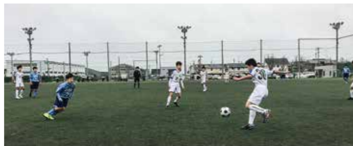
←1部リーグ優勝を目指す選手たち