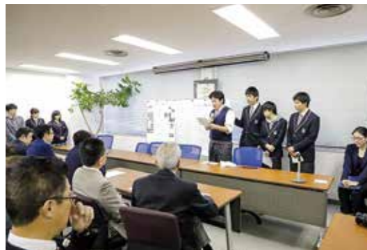
↑意見交換会の様子